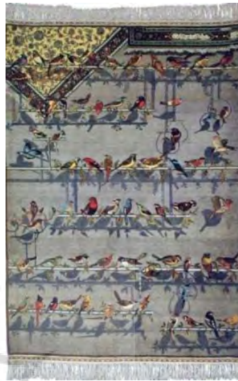
تصویر ۱۲- فرش مرغان در بند (ULRI).

قیدها و بندها، نقش سازنده‌ای داشته باشد؛ بر این باور به طراحی این اثر پرداخته و به کمک یک زندانی آن را بافته است؛ تا شعله عشق آزادگی در وجود زندانی زبانه کشد و به شور چنان عشقی از بند برهد و به کالبد اثر هنرمندانه‌اش جان تازه‌ای دمد.