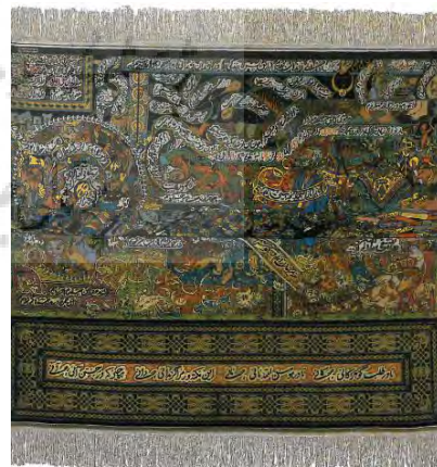
تصویر ۵- قالی انقلاب در انقلاب (سرمدی، ۱۳۸۲: ۱۱۹).

در مرحله خلق این اثر، واقعه‌ای رخ می‌دهد، از یک سو، انقلاب مردم ایران شکل می‌گیرد و از سوی دیگر، این بافته - که کارگاه آن درون زندان است - گم می‌شود؛ چندسالی به طول می‌انجامد، تا اثر نیمه کاره پیدا شده و به دست استاد برسد. اکنون انقلاب اسلامی رخ داده و نظام دیگری در جریان زندگی مردم قرار گرفته است. عربزاده نیز باید بیان گر این واقعه باشد، پس، به تصویر انقلاب می‌پردازد و این خود از ابتکارات کم‌نظیر استاد است؛ و شاید اولین بار است که فرش ایران، به‌عنوان یک اثر هنری معرفی یک واقعه تاریخی است. علاوه بر آن، استاد با نشان دادن تصاویر مردم در تظاهرات، تاریخ خلق این اثر را به ثبت می‌رساند (سرمدی، ۱۳۸۲: ۱۱۸). نمادها و نشانه‌های مرتبط با انقلاب اسلامی در این اثر، به صورت نواری در میانه اثر و صحنه‌هایی از تظاهرات مردمی و شعارهای انقلابی‌شان نمایش داده شده است. رسام عربزاده، بسیار اندیشمندانه ضمن روایت این رویداد مهم تاریخی، از این نوع تصویرگری در جهت ادامه بافت این اثر استفاده کرده است. نیمه پایینی و بالایی اثر از لحاظ رنگ و تا حدودی طرح متفاوت هستند.