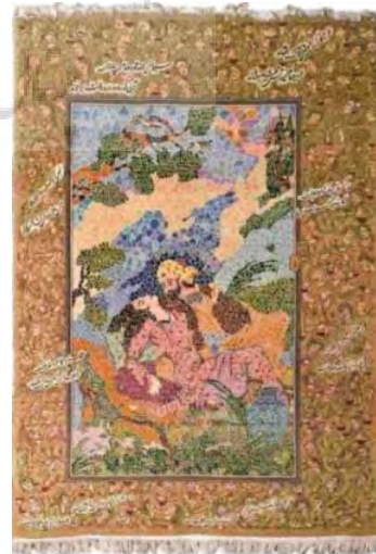
تصویر ۳- فرش غنیمت عمر (ULR1).

این قافله عمر عجب می‌گذرد که با طرب می‌گذرد (خیام، ۱۳۶۵: ۳۴۵).