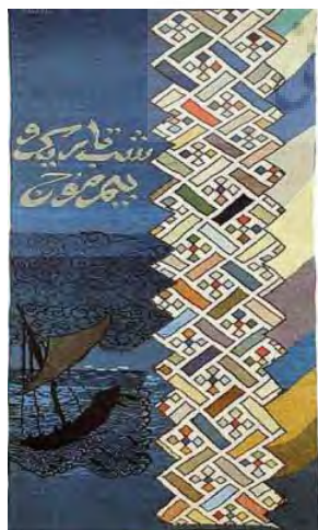
تصویر ۲- گلیم- فرش بیم موج (ULR1).

شب تاریک و ترس از امواج و گردابی این‌گونه هولناک، آن‌ها که بر ساحل دریا آسوده می‌گذرند، کی حال ما را می‌دانند؛ برای نشان دادن حال وحشت و سرگردانی خود در جست‌وجوی راز خلقت، نمایی از وحشت شب و دریا و طوفان ساخته و آن را در برابر آرامش سواحل آرام قرار داده است؛ خود را به عنوان سالک راه طریقت به کسی تشبیه کرده که در شبی تاریک بر کشتی نشسته و بیم موج و گرداب مرگ او را تهدید می‌کند؛ و سبکباران ساحل‌ها آن‌ها هستند که فارغ از تامل و تفکر در این‌گونه مسایل، آسوده زندگی می‌کنند؛ تاریکی مسایل ماوراءالطبیعه به مثابه شب تاریک، بیم فرو افتادن در گرداب شک و گمراهی و سرانجام گرداب هایل مرگ هر کدام به نوعی در این نما جلوه‌گرند.