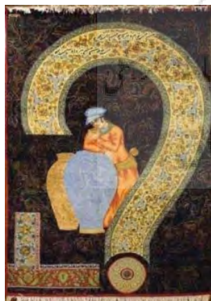
تصویر ۱۰- فرش اسرار جهان(ULR1).