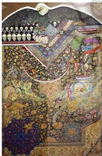
تصویر ۷- فرش جهان نما(ULR1).