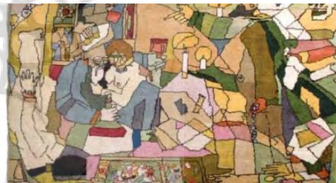
تصویر ۸- فرش خلوت رندان(ULR1).