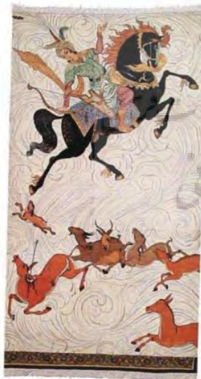
تصویر ۴- قالی کار نیکو کردن از پر کردن است (ULR1).

مضمون این اثر، صحنه‌ای از شکار بهرام گور است که به سبک مینیاتور طراحی شده و به‌غایت زیبایی و ظرافت در تار و پود فرش جای گرفته است. یکی از مضامین مورد استفاده در نقش پردازی‌های سنتی ایران، صحنه شکار و شکارگاه است؛ به‌ویژه، شکارگاه بهرام گور، که در تاریخ ادبیات فارسی نیز از آن سخن، بسیار رفته، و قصه منظوم (بهرام و کنیزک) حکیم نظامی شاعر بلند آوازه نیز از آن جمله است. رسام با الهام از منظومه معروف نظامی، صحنه شکار را با توانایی کم‌نظیر، به‌گونه‌ای طراحی کرده که زبردستی و چالاکی بهرام، به‌خوبی نمایان است؛ و در انتخاب عنوان نیز بسیار هوشمندانه از گفته کنیزک در جواب عمل بهرام بهره برده است. عنوان در کنار متن حاوی پیام عمیقی برای مخاطبین است و در خوانش متن نقش موثری دارد.