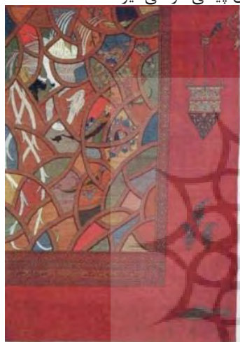
تصویر ۹- فرش پنجره خیال(ULR1).

ترکیب طرح‌های هندسی ساده به مدد رنگ‌های سرد و گرم فضای شاد و زنده‌ای از خلوت مورد نظر حافظ پدید آورده که علی‌رغم درهم ریختگی عمدی صور طراحی، رازی پوشیده نمی- ماند(ULR1).