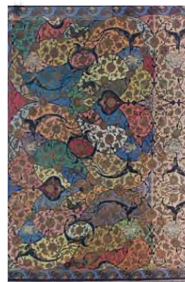
تصویر ۱۱- فرش کشکول(ULR1).

این اثر طرحی نو و ابتکاری، و اثری بی‌سابقه و در عین حال اقتصادی از رسام عرب‌زاده است؛ و شرح حکایت آن از زبان استاد درس اقتصاد و عدم اسراف را به هنرآموزان و هنرمندان آینده می‌آموزد. غالباً، دیده شده است که تکه نخ‌های الوان در جای جای کف کارگاه‌ها بی‌مصرف مانده که به اصطلاح نخ‌های دوریز نام دارد. استاد می‌گوید: «مقادیری از این نخ‌ها درون کیسه‌ای انباشته شده بود. بر آن شدم تا آن‌ها را در بافت فرش خارج از نقش‌پردازی‌های متعارف به مصرف رسانم. کار بافت به پایان رسید؛ اما بی‌نام. سرانجام، دوستان هنردوست مجله جوانان در بازدید از مجموعه فرش‌هایم به یاد اثر شیخ بهایی عنوان کشکول را بر آن نهادند»(ULR1).