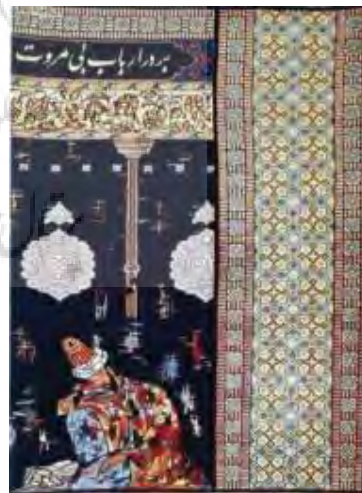
تصویر ۱- گلیم- فرش بر در ارباب مروت (ULR1).

عبارت بر در ارباب مروت، که زمینه آن هم‌رنگ در است، چنان روشن نوشته شده که چون چراغی راهنمای سراب دیدگان است؛ از این‌رو، عنصری است که چون در عنوان حضور داشته در انتقال مفهوم متن فرش تاثیرگذار است. گاهی اوقات خود نوشتار در اثر، می‌تواند عامل شناسایی و خطاب قرار بگیرد؛ حتی اگر خالق و مولف، عنوانی برایش برنگزیده باشد؛ و هیچ عاملی بهتر از شعر در فکر و اندیشه آدمی نقش نمی‌بندد و صورتی زیباتر از آن در پرده خیال و تصورات آدمی رخ نمی‌نماید.