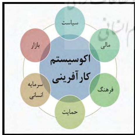
شکل ۱- مدل مفهومی اکوسیستم کارآفرینی (Isenberg, 2010:46).

سازمان توسعه صنعتی ملل متحد (۲۰۱۰) محیط کسب و کار را مجموعه قوانینی که بر هزینه شرکت‌ها تاثیر دارد، تعریف می‌کند (داوری، ۱۳۹۲: ۳). بر اساس این تعریف، یونید محیط کسب و کار را دربرگیرنده سه لایه می‌داند: لایه مرکزی، که همان محیط کسب و کار قانونی است و دربرگیرنده قوانینی است که به افزایش هزینه‌های مستقیم و غیرمستقیم شرکت‌ها منجر می‌شود؛ مانند هزینه‌های نیروی کار، تاسیس و انقلاب شرکت، مالیات و...؛ لایه میانی، دربرگیرنده فضای سرمایه‌گذاری است که علاوه بر عناصر محیط قانونی، شامل کیفیت زیرساخت‌ها، رژیم قانونی، ثبات سیاسی بازارهای مالی، آموزش و... می‌شود و می‌تواند به رشد،