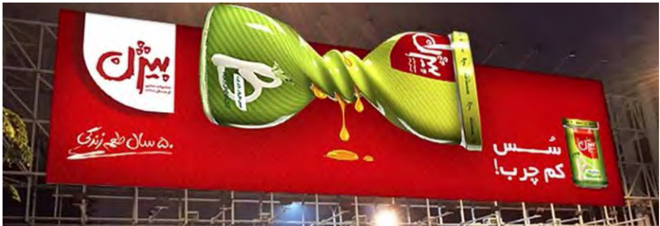
تصویر ۴. تبلیغ سس مایونز کم چرب بیژن، گروه تخصصی تبلیغات ماوی دیزاین، ۱۳۹۴.