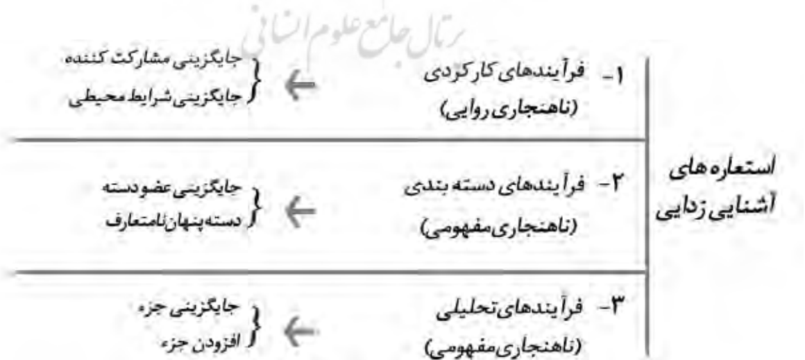
تصویر ۲. مکانیسم‌های گوناگون استعاره‌های آشنایی‌زدایی.

معانی تعاملی که در تصویر ۳ مشاهده می‌شوند؛ در حقیقت سامانه‌ای از استعاره‌های مفهومی هستند که به صورت بصری تحقق می‌یابند و مبتنی بر پژوهش‌های کرس و ون لیوون (۱۳۹۶) است که به صورت جامع قاعده‌مند شده‌اند (Feng & O'Halloran, 2013, 329). فاصله نمای تصویر ۵۲ ، که گستره‌ای است از نمای نزدیک ۵۳ تا نمای باز ۵۴ ، بیانی استعاره‌ای از فاصله اجتماعی ۵۵ بین بیننده و تصویر یا به عبارت دیگر بین مخاطب و محتوای تبلیغاتی است. از سوی دیگر، زاویه دید عمودی ۵۶ بیان استعاره‌ای از قدرت و برتری است و همچون موقعیت‌های مختلف زندگی واقعی است؛ بدین صورت که به افراد قدرتمند، نگاهی از پایین به بالا دارد و به افراد ضعیف