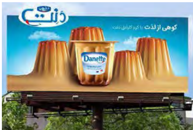
تصویر ۵. تبلیغ کرم کارامل دلت، ایران ادز، ۱۳۹۷.

این بیلبورد برای محصول لوله‌های پلیمری طراحی شده است (تصویر ۱-۷). مکانیسم بازنمایی بصری استعاره از نوع استعاره آشنایی‌زدایی بوده و در آن رابطه جزء-کل مشاهده می‌شود که از نوع تحلیلی است. این بیلبورد به مناسبت نوروز طراحی شده و با توجه به محتوای فرهنگی نوروز در کشورمان، طراح سبزه عید را به کار برده است. سبزه به عنوان ماهیت کل است که جزء متعارفی از آن (برگ‌های تازه جوانه زده) با جزء نامتعارف (لوله‌های سبز) جایگزین شده است. صفت بارز سبزه عید، جوانه‌زدن و رشد و آغاز زندگی دوباره است و در این استعاره این صفت به لوله نسبت داده شده است. قابل ذکر است که این لوله‌ها در مقایسه با لوله‌های فلزی مزایای بسیاری دارند که در صورت جایگزینی با لوله‌های فلزی سنتی تفاوت کاربردی چشمگیری خواهند داشت. اگر از این منظر به بیلبورد توجه کنیم می‌توان گفت که استعاره حاضر به لحاظ تبلیغات محصول چندان قوی و گویای صفات لوله سبز نیست اما باید توجه داشت که آنچه مورد توجه طراح بوده به یقین رویکرد زیباشناسی و محتوای فرهنگی به‌منظور تبریک سال