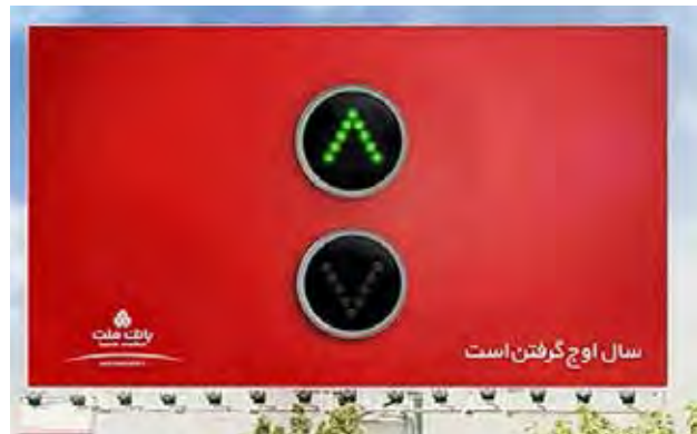
تصویر ۶. تبلیغ بانک ملت، دی ان ای یونیون، ۱۳۹۸.

بررسی جامعه آماری بیلبردهای ایرانی که در ایده‌پردازی آنها از استعاره بصری استفاده شده همانطور که انتظار می‌رفت قابل تطبیق با مکانیسم‌های ارائه شده توسط فنگ و او‌هالوران (Feng و O'Halloran) است. به جهت مطالعه مکانیسم‌هایی حاوی انواع مختلف بودند؛ حداقل یک مورد از هر نوع، مورد توجه واقع شد که نتایج حاصل از آن نشان می‌دهد که بیلبردهایی که در ایده‌پردازی از استعاره بصری بهره گرفته‌اند؛ قابل تطبیق با یکی از این مکانیسم‌ها است و در طراحی گرافیک می‌توان با اتکا به آنها به خلق استعاره بصری دست یافت. از تحلیل جامعه آماری مشتمل بر ۳۵