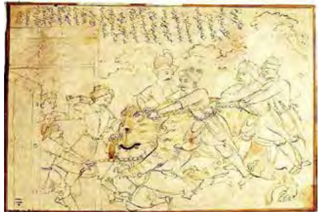
تصویر ۵. نقاشی «حمله ببر به جوان» رقم معین مصور، ۱۰۸۲ ه.ق. . محفوظ در موزه هنرهای زیبای بوستون

اما نکته جالب در این دسته از آثار معین مصور پیدایش توضیحات و رقم‌هایی طولانی در حاشیه آنها است. برای نمونه در حاشیه اثر «حمله ببر به جوان» (بنگرید به تصویر ۵) معین مصور متنی طولانی می‌نویسد و از زمان و چگونگی وقوع حادثه و همچنین مشکلات مردم، بازار و آب‌وهوا سخن می‌گوید. شیلا کنبی اهمیت رقم‌زنی در مکتب اصفهان را به این امر منتسب می‌کند که «حامیان جدید هنر برای اصالت کار اهمیتی درخور قائل بودند» (همان، ۱۶)، همچنین کریم‌زاده تبریزی از دشواری نوشتن خط «شکسته قلم‌موئی» صحبت می‌کند که معین مصور عموماً با آن آثار خود را رقم می‌زد. چنین شکل رقم‌زنی باعث می‌شد که آثار اصل از تقلبی بازشناخته شود (کریم‌زاده تبریزی، ۱۳۷۰، ۱۱۸۳). با توجه به مباحث فوق می‌توان گفت این تحشیه‌ها در آثاری مانند «حمله ببر» (بنگرید به تصویر ۵) یا نقاشی «دو دل‌داده» (بنگرید به تصویر ۶) در حکم بازگشت «کلام» به تصویر است. در «حمله ببر به جوان» به‌نظر می‌رسد این جملات به‌گونه‌ای جای خالی روایت‌های متنی را گرفته‌اند. به‌طور کلی این تحشیه‌ها در نهایت در حکم رسوخ دوباره متن