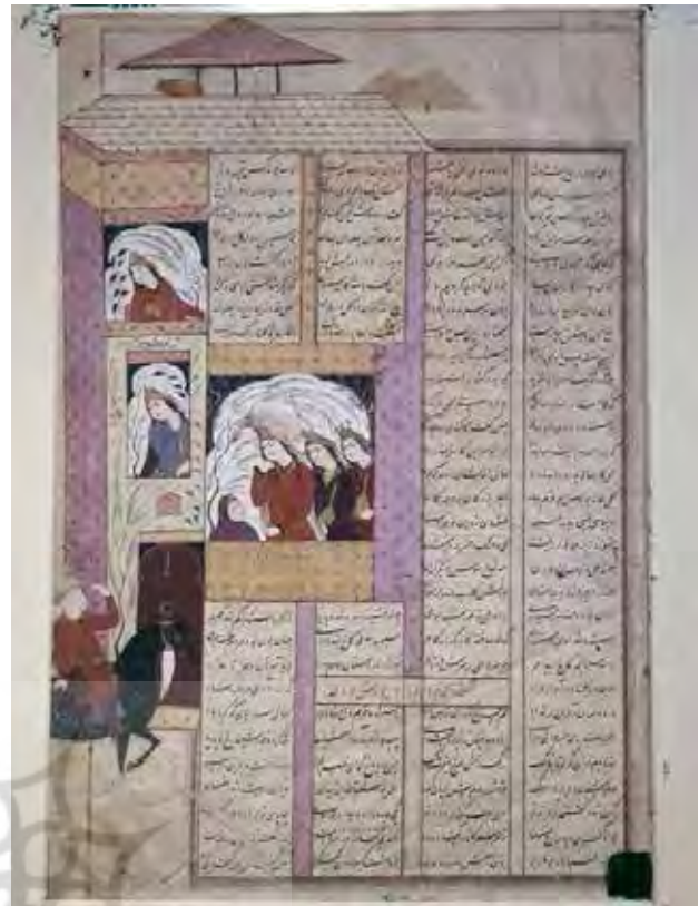
تصویر ۱. نگاره «زال در پیشگاه قصر رودابه»، رقم معین مصور، نیمه‌ی دوم قرن یازدهم ه.ق. محفوظ در موزه آقاخان.

معمولاً در یک اثر واحد از نگارگری ایرانی صحنه‌های روایی در اپیزودهای متوالی تصویر نمی‌شدند. از این رو در نقاشی ایرانی عموماً روایت به صورت «همزمان» ترسیم می‌شد. اما در عموم این نگاره‌ها این زمانمندی پنهان قابل تشخیص است. مقایسه‌ی تصویر ۲ با تصویر ۳ می‌تواند آشکارگر تغییر مهم در ترکیب‌بندی نسخه‌نگاره‌های معین مصور باشد. این نقاشی روایت «کشته‌شدن خسرو» در نسخه‌ی مصور «شاهنامه» شاه‌طهماسبی است. تصویر «لحظه‌ی زایا» در سمت چپ نقاشی مشخص است، اما این نقاشی، غیر از این صحنه، واجد