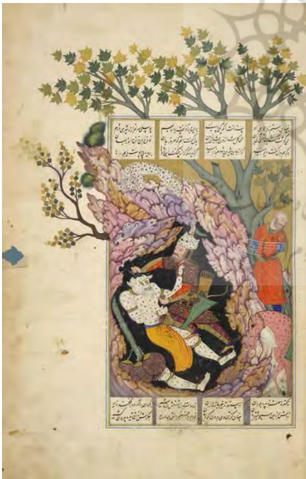
تصویر ۲. نگاره «رستم دیو سپید را می‌کشد»، منسوب به معین مصور، میانه‌های قرن یازدهم ه.ق. محفوظ در کتابخانه بریتانیا.

در بسیاری از نگاره‌هایی که معین مصور برای تصویرسازی این نسخه‌ها به انجام رسانده است، رسوخ عینی متن در تصویر مشهود است. در برخی از نگاره‌ها مانند تصویر ۱ متن بیشتر سطح برگه را می‌پوشاند، ولی در غالب آثار، ابیات مهم متن که ارتباط مستقیمی با موضوع نقاشی دارند در جدولی در حاشیه‌ی تصویر گنجانده شده‌اند. به‌طور کلی هیچ تصویری به‌صورت مستقل و بدون وجود سطحی متنی دیده نشده است. تصویر ۲ که از نسخه‌ی شاهنامه‌ی دیگری انتخاب شده است مؤید این مطلب است. در اینجا نیز متن «روی» بخش‌هایی از تصویر قرار گرفته است، چنانکه در قسمت بالای نقاشی باعث انقطاع تصویر درخت شده است. اما این تصویر نشان‌دهنده‌ی وجهی دیگر از رسوخ متن به درون تصویر است که در نسخه‌نگاره‌های معین مصور عمومیت دارد.