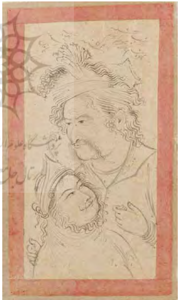
تصویر ۶. «دو دل‌داده» رقم معین مصور، ۱۰۵۲ ه.ق. . محفوظ در گالری فریر.