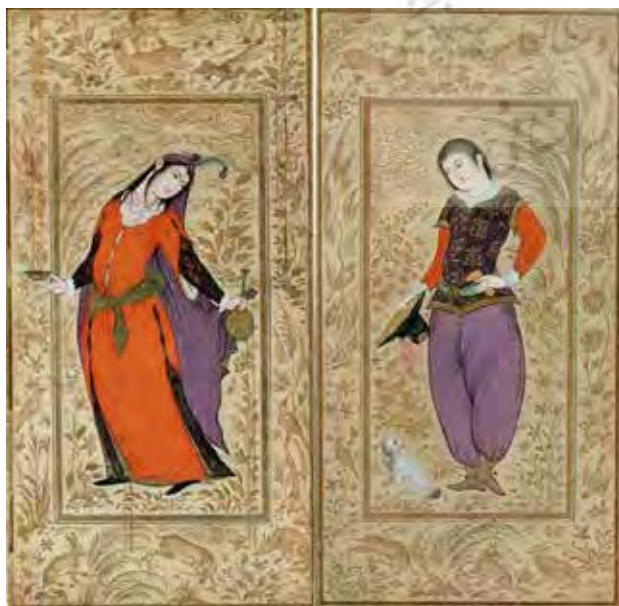
تصویر ۴. دو نگاره از یک نسخه شاهنامه مصور، رقم معین مصور، نیمه دوم قرن یازدهم ه.ق. . محفوظ در مجموعه ناصر خلیلی.

گروه پیکره‌ها و خرده‌صحنه‌هایی است که بیننده آنها را در توالی زمانی «دریافت» می‌کند. در اینجا می‌توان از دیدنی شبیه به خواندن صحبت کرد. همان‌گونه که گفته شد، همسویی یا تجانسی میان رسانه، محتوا و شیوه دریافت در تمایز هنرهای زمانی و مکانی وجود دارد. نحوه دریافت یا دیدن این نقاشی آشکارا واجد ردپایی زمانی است. اما آنچه از مقایسه این نقاشی با نقاشی معین مصور (بنگرید به تصویر ۲) مشخص می‌شود کاهش خرده‌صحنه‌ها و خرده‌روایت‌های حاشیه‌ای و تمرکز بیشتر بر تصویر «لحظه زایا» در تصویر روایت‌های ادبی است. در بسیاری از نسخه‌نگاره‌های مکتب اصفهان به‌ویژه بعد از گسترش زیباشناسی «رضا عباسی»، این امر آشکار است. نسخه‌نگاره‌های این مکتب فیگورهای انسانی با تعدادی کمتر و بزرگ‌تر از حالت مرسوم در مکاتب پیشین ترسیم می‌شدند (اشرفی، ۱۳۹۶، ۱۲۸). در نسخه‌نگاره‌های معین مصور نیز، به پیروی از اصول ترکیب‌بندی مکتب اصفهان، خرده‌صحنه‌ها و خرده‌روایت‌ها کاهش پیدا می‌کند و تمرکز بر صحنه اصلی تصویر قرار می‌گیرد و از این رو این نگاره‌ها از «توالی دریافت» به‌عنوان مقوله‌ای زمانی، که مشخصه دریافت «متن» و «روایت ادبی» است، فاصله گرفته‌اند و بنابراین «تجانس» بیشتری میان رسانه، محتوا و شیوه دریافت برقرار شده است؛ به عبارتی اثر نسبت به نسخه‌نگاره‌های پیشین «نقاشانه‌تر» شده است.