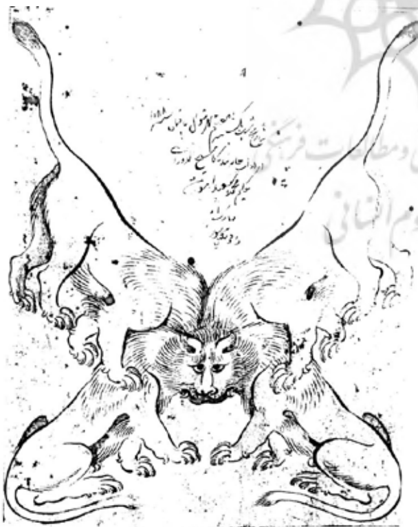
تصویر ۷. «شیر یک سر و چهار تن» رقم معین مصور، ۱۰۸۸ ه.ق. . مأخذ: جوانی، ۲۴۸، ۱۳۹۰.