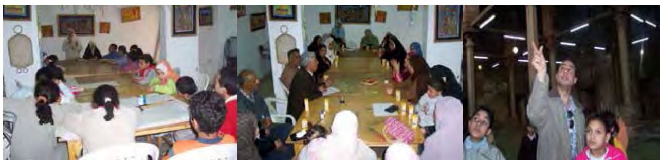
تصویر ۶. مسئولان در حال توضیح اقدامات حفاظتی برای مردم محلی، کودکان و دانش‌آموزان. مأخذ: Lamei, 2011.

جدول ۲. سیاست‌های گردشگری پایدار به‌کاررفته در پروژه مرمت خیابان المعز. مأخذ: نگارنده.