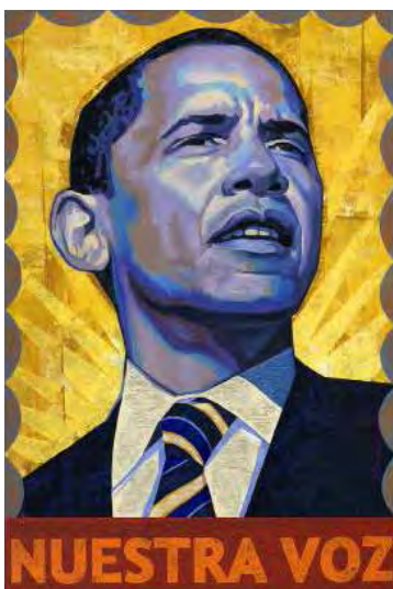
تصویر ۴. رافائل لوپز، تلفیق تصویر کاندیدای ریاست جمهوری با عناصر انقلابی از امریکای جنوبی.

کاندیدا در حالی که در مرکز تصویر قرار گرفته، تمامی کادر را اشغال کرده و نگاهی با شیب تند و مصمم به دور دست دارد، اشعه‌های آفتاب در پشت سر و اندک اخم روی پیشانی که حاکی از عزم راسخ است به این تصویر آیکونوگرافی انقلابی می‌بخشد. تضاد میان رنگ آبی و زرد از سویی و قاب بسته دور کادر و