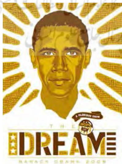
تصویر ۳. «ری نولاند»، The Dream. تلفیق تصویر کاندیدا با عناصر زندگی روستایی امریکای لاتین به همراه آیکونولوژی مذهبی از طریق اشعه‌های آفتاب در پشت سر.