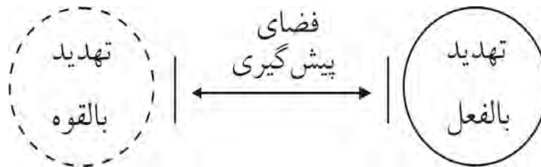
نمودار شماره ۱: فضای پیشگیری در رهیافت عرفی‌گرا

مهم‌ترین نقد بر این رهیافت به محدود بودن آن ناظر است. گستره تأثیرات رهیافت عرفی‌گرا در مقایسه با رویکرد بدیل که قایل به دو ساحت دنیا و آخرت است اندک می‌باشد و، در نتیجه، این محدودیت و، به طور طبیعی، توان اجرایی آن نیز اندک خواهد بود. (افتخاری، ۱۳۸۴: ۴۰-۹۲) درک این مطلب نیازمند توجه به ویژگی‌های دنیا در گفتمان اسلامی است.