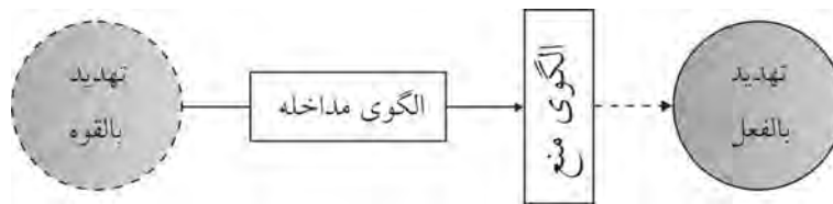
نمودار شماره ۳: الگوهای منع و مداخله برای پیشگیری در رهیافت سکولاریستی

در نمودار زیر این دو نوع رویکرد با یکدیگر مقایسه شده‌اند. چنان‌که ملاحظه می‌شود، الگوی ایجابی پیشینی بوده، بر تهدیدات بالقوه تأثیر می‌گذارد، حال آنکه الگوی سلبی به صورت پسینی عمل نموده، فرایند تحول تهدید بالقوه به تهدید بالفعل را هدف قرار می‌دهد. (نگاه کنید به نمودار شماره ۳)