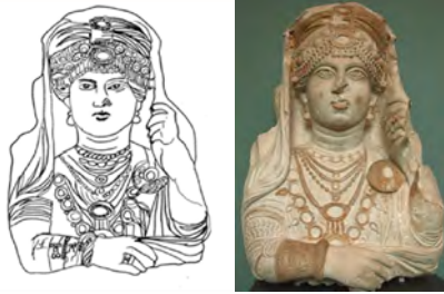
شکل و طرح ۵. (کالج، ۱۹۷۶: ۲۰۰)، طرح از نگارنده (ذوالفقاری، ۱۳۹۱: ۲۶۸)

سیاهی رنگ بر روی این اثر هنوز قابل مشاهده است (کالج، ۱۹۷۶، ۱۹۷۶)، ترجمه رجب‌نیا، ۱۳۸۸: ۲۴۲). حالت ناامیدی و یاس این چهره به خوبی بیان‌کننده آن است که متعلق به یک مقبره می‌باشد. حالت زنانه زن در حفظ و نگه داشتن پوشش سر و شالش به تصویر زیبایی زنانه خاصی بخشیده است. استفاده بسیار زیاد از جواهرات و زینت آلات می‌تواند روشن‌کننده این نکته باشد که احتمالاً این زن به طبقات بالای جامعه و قشر ثروتمند تعلق داشته است. تاریخ این نقش برجسته به اوایل سده ۳ میلادی مربوط است و در موزه کوپنهاگ دانمارک نگهداری می‌شود.