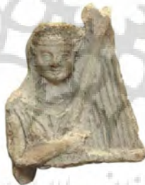
شکل و طرح ۳. چنگ نواز سفالی، طرح از (ذوالفقاری، ۱۳۹۱: ۲۳۷)