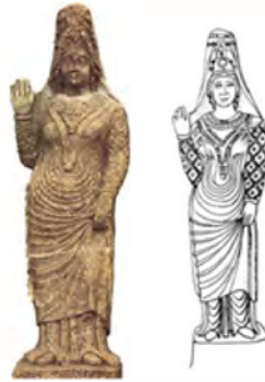
شکل و طرح ۴. (گریشمن، ۱۹۶۲، ترجمه فره‌وشی، ۱۳۵۰:۹۵)،

مربوط به مقدس بودن پیکرک‌ها است. همواره در این رابطه دو ویژگی مورد توجه قرار گرفته: اول تاکید بر عناصر جنسیتی و دیگری زاینده بودن زن است. عنصر جدید در این دوره تجسم زنان در سنگ مرمناست، به گونه‌ای که با آرنج چپ روی یک تخت یا راحتی لمیده و دست راست آن‌ها بر روی ران قرار دارد. به گفته (فن در استن، ۱ ۱۹۵۶:۳) این بانوان لمیده نشان‌دهنده الهه آناهیتا هستند. هزاران تندیس بر جای مانده نشان می‌دهد که آناهیتا از توجه توده‌های وسیع مردم برخوردار بوده است (رجبی، ۱۳۸۵:۱۹۱).