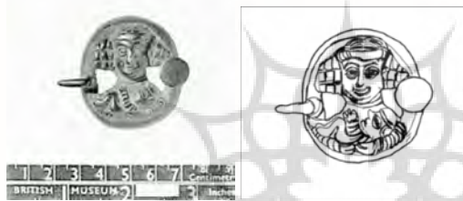
شکل و طرح ۱۰. سگک کمربند با نقش مادر و فرزند، موزه بریتانیا، طرح از نگارنده (ذوالفقاری، ۱۳۹۱: ۲۷۷)

شکل ۱۰، سگک کمربندی را با نقش مادری که فرزندش را در بغل گرفته نشان می‌دهد، پیشانی‌بندی نیز بسته است. این شیئی مسی به قطر: ۴/۲ سانتی‌متر و پهنای ۵/۱ سانتی‌متر از ایران کشف و در سال ۲۰۰۱ به موزه بریتانیا اهدا شده است. زینت آلات زیادی از دوره اشکانی، اعم از سگک کمربند و یا گیره و سنجاق مو با نقش زنان به دست آمده است (ذوالفقاری، ۱۳۹۱).