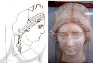
شکل و طرح ۱. موزه ملی ایران، عکس و طرح (ذوالفقاری، ۱۳۹۱: ۲۲۱)