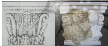
شکل و طرح ۶. کاتالوگ موزه ملی ایران، (۱۳۷۸)

قسمتی از ستون گچبری شده با نقش زن (شکل ۶) مربوط به اواخر دوران اشکانی، اوایل ساسانی از قلعه ضحاک هشتروند (آذربایجان شرقی) کشف شده است. سر زن نسبت به بقیه اندام‌ها برجسته‌تر و دارای دو بال به سمت بالاست. در اطراف او طومارهایی (شاید سمبل) قرار دارد. احتمال دارد تصویری از الهه نیکه باشد (کاتالوگ موزه ملی ایران، ۱۳۷۸).