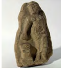
شکل ۹.

شکل ۷. (گریشمن، ۱۹۶۲، ترجمه فره‌وشی، ۱۳۵۰: ۴۵) شکل ۸. (گریشمن، ۱۹۶۲، ترجمه فره‌وشی، ۱۳۵۰: ۴۲)