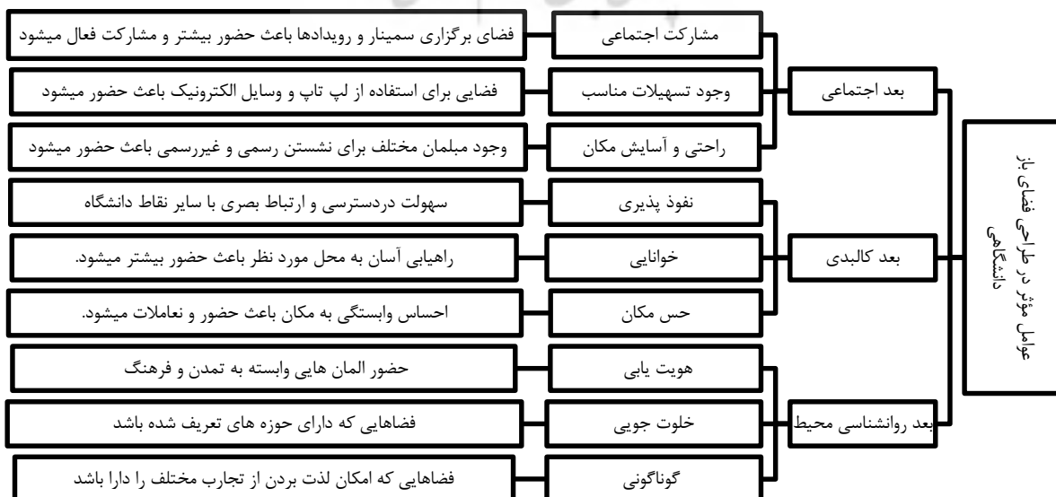
شکل ۳. عوامل مؤثر در طراحی فضای باز دانشگاهی. (نگارندگان)