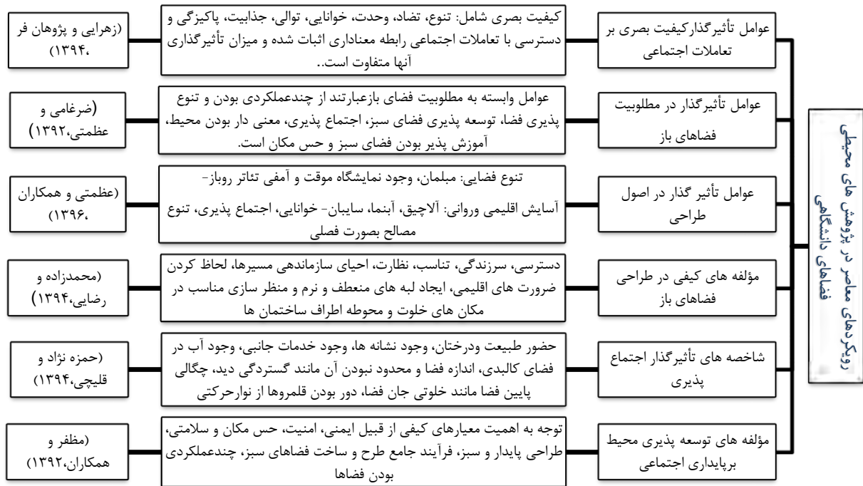
شکل ۲. رویکردهای معاصر در پژوهش های محیطی فضاهای دانشگاهی. (نگارندگان)

در ادامه پژوهش شاخصه های بدست آمده از مطالعات پیشین در رابطه با عوامل مؤثر در طراحی فضای باز در جدول زیر آمده است. رویکردهای بررسی شده شامل موارد زیر است که از آن ها به برخی از عوامل مؤثر در طراحی فضاهای باز میتوان دست یافت: