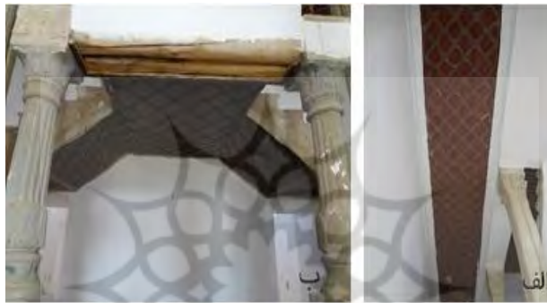
تصویر (۵) سقف پلکان

سقف پلکان ما بین دو طبقه دارای گره های لوزی مربع از جنس چوب و رنگ شده، به مساحت ۳۲.۲۶ متر مربع است. و قسمت زیرین محل تلاقی پلکان، دارای گره لوزی مربع است. وسط هر یک از قاب ها، میخکوبی با نقش چلیپایی به کار برده شده است. این گره به مساحت ۸.۸ متر مربع کار شده است. در سقف ایوان ها تنها قاب دور تادور به جای مانده و قسمت وسطی کاملاً تخریب شده است (احمدی و اصغریان، ۱۳۹۸: ۷۲). تصویر شماره (۵)