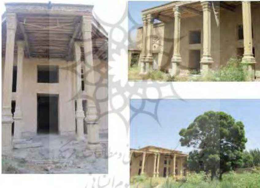
تصویر شماره (۲) قلعه صمصام السلطنه شلمزار

مساحت این قلعه حدود هزار متر مربع است. شکل بنا مستطیل بوده و در دو طبقه ساخته شده است (سایت استان چهار محال و بختیاری) این قلعه درونگرا بوده که تزئینات وابسته معماری بنا شامل نقوش سنگی، تزئینات آجری و پروازبندی‌های سقف است (عربشاهی، ۱۳۹۳: ۱). پلان قلعه مستطیل و دارای ایوان ستوندار روبه جنوب است. مصالح به کاررفته در آن خشت با نمای آجر و ملاط گچ و خاک است. ایوان از وسط دارای پیشخوان دو ستونی و درب ورودی اصلی اعیانی رو بروی پیشخوان قرار دارد، بنا شامل: ده اتاق و سه انبار متصل به آنست. سقف اتاقها با طاق ضربی و سقف ایوان با تیر چوبی پوشیده شده و پشت بام تمامی بنا مسطح و دیوارها با گچ اندود گردیده اند. رو بروی درب اصلی راه پله سنگی طبقه فوقانی واقع شده است. اتاقها در دردیف قرار دارند (امام بخش و صفایی بروجنی، ۱۳۹۹: ۵۷). تصاویر شماره (۲)