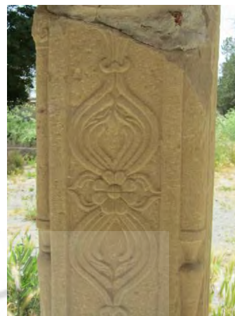
تصویر شماره (۸) طرح ستونهای حجاری شده

ستونها از نوع چهارگوش شیاردار هستند و در زوایای آنها (شبیبه پاستونها) گلدان هایی حجاری شده است. که ساقه گل تا انتهای ستون ادامه دارد و در رأس آن چند برگ گل مشاهده می گردد. در هر جانب ستون یک شیار وجود دارد، سرستون ها از نوع مختلط هستند و نقوش مختلط گیاهی به صورت متعادل و زیبا در سر ستون ها حجاری گردیده است.