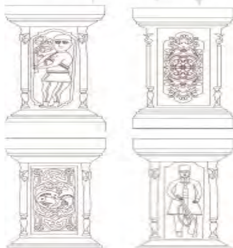
تصویر شماره (۱۰) ستونهای حجاری شده زیر راه پله (امام بخش و صفائی بروجنی، ۱۳۹۹: ۷۰).

زیر راه پله ای که از پاگرد تا پشت بام امتداد دارد، چهارستون سنگی قرار دارد. ستون های ابتدای راه پله کوتاه و ستونهای دوم، تقریباً به ارتفاع ستون های ایوان هستند، هر چهارستون از نوع چهارگوش شیاردار می باشند. در دو طرف پاستون ستون های بلند (نقش اژدهایی در حال بلعیدن بره ای) می باشد داخل یک کادر مستطیل حجاری گردیده است. در زوایای کادر نقش چهار ستاره مشاهده می گردد. نقش سرستون ها را نقوش گیاهی تشکیل می دهد. پاستون ستون های کوتاه، از روبرو دارای نقش انسانی هستند، که تفنگی را بدست گرفته در حال حرکت است و از روبرو نگاه می کند. در لوله تفنگ او یک شاخه گل قرار دارد این دو نقش که شبیه به هم هستند، شل به دوش، قطار فشنگ به کمر بسته، کلاه نمدی به سر، چکمه به پا و شلوار پوشیده اند. طرف دیگر این پاستون ها نقوش گیاهی حجاری شده و در زوایا مانند پاستون های ایوان دارای نقش گل و گلدان هستند. ستون ها و سر ستون های این دو شبیه دو ستون بلند مقابل آنهاست. نقوش ستونها هرگز به صورت یکنواخت تکرار نشده اند بلکه تکرار آنها حالتی متناوب دارد. تزئینات سنگی معمولاً پردوام ترین نوع تزئینات در یک بنا هستند و به همین دلیل است که تقریباً همه تزئینات غیر سنگی تخریب شده و از بین رفته اند. تصویر شماره (۱۰)