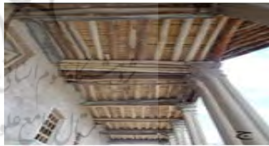
تصویر (۶) نمایی از قلعه صمصام السلطنه شلمزار (نگارنده)

دارای چندین اتاق بصورت طاق و چشمه و با خشت خام ساخته شده است و محکم و استوار باقی مانده است. جلو این اتاق راه، ایوانی با ستون های سنگی در بر گرفته است که به شیوه زیبایی و با نقوش حجاری شده گیاهی، تزیین شده است (احمدی و اصغریان، ۱۳۹۸: ۷۲).