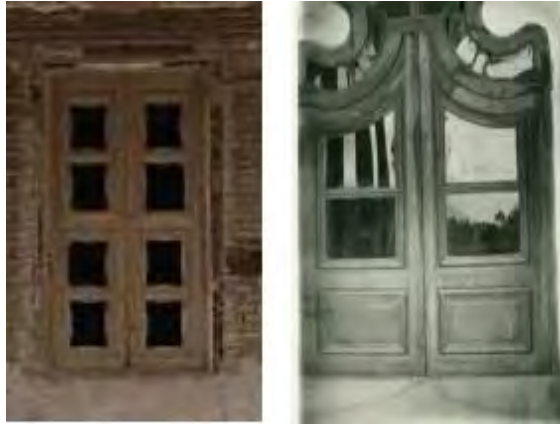
تصویر شماره (۱۱) نمونه ای به جای مانده از بازشوهای بالای درب اصلی ورود به عمارت

هنر چوب آرابی در درب های اصلی دو طبقه اعیانی، قاب بندی های زیر سقف ونرده لبه راه پله بکار رفته است. دودرب چوبی شبیه به هم در قلعه موجود است. درب اصلی طبقه همکف تقریباً سالم و درب اصلی طبقه فوقانی که از جای کنده ودر باغی در روستای ایرانچه نصب گردیده که صدمات زیادی دیده و تقریباً قابل تعمیر نیست. این درب ها دولنگه و دارای چهارچوب شیاردار هستند که دربالا به صورت نیم بیضی درآمده است. نیم بیضی پائین شبیه " آکلاد" شیاردار است، که از میان آند و نیم قوس منشعب گردیده است. به نظر آقای آخوندی منظور هنرمند چوب آرا در این قسمت درب نشان دادن دو چشم در طرفین و ابروان در بالا بوده است که شاید در ارتباط با چشم زخم و نظر زدن بوده است. هر دولنگه درب دارای یک قاب بزرگ در بالا و یک قاب بزرگ در پائین هستند(امام بخش و صفائی بروجنی، ۱۳۹۹: ۷۰-۷۱). تصاویر شماره (۱۱) و (۱۲)