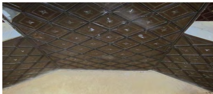
تصویر (۳) معماری قلعه صمصام السلطنه شلمزار (قربانی و ولی بیگ، ۱۳۹۴: ۱).

طبقه اول دارای چندین اتاق با طاق و تویزه و با خشت خام پوشش شده. بسیار محکم و استوار باقی مانده است. جلو این طاق را ایوانی با ستون های سنگی در بر گرفته است. که با نقوش حجاری شده گیاهی تریئین شده است. طبقه دوم که ایوانی ستون دار مشابه طبقه همکف داشته است خراب شده و آثار زیادی متاسفانه بر جای نمانده است. تصویر شماره (۳)