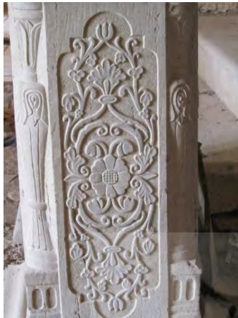
تصویر شماره (۹) طرح ستونهای حجاری شده

ایوان در کل دارای ۱۸ ستون سنگی است. لبه ایوان با تخته سنگی لبه دار پوشیده شده است، و روی آنها پا سنگ ستون قرار دارد که چهار طرف آنها فرز کاری شده است. پاستونها در چهار جانب دارای نقوش حجاری شده هستند که این نقوش به صورت قرینه روبروی هم قرار دارند و عبارتند از: نقش گل و گلدان (گلدانها پایه دار و زیر آنها نقش چهارپایه حجاری گردیده است) و دو نقش مرکب دلخواه حجار. در زوایای پاستونها نقش گلدان حجاری شده که ساقه گل به صورت ساده بالا آمده و در رأس آن چند برگ قرار دارد. خشت های زیر ستونها دارای مقاطع مربع هستند، که اضلاع به صورت برجسته فرز کاری شده است و پایه ستون ها دارای نقوش گیاهی حجاری شده هستند (امام بخش و صفائی بروجنی، ۱۳۹۹: ۶۹-۷۰). تصویر شماره (۸) و (۹)