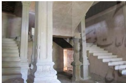
تصویر (۷) نمایی از ستون و پلکان قلعه صمصام السلطنه شلمزار

در سقف ایوان ها تنها قاب دور تادور به جای مانده و قسمت وسطی کاملاً تخریب شده است (احمدی و اصغریان، ۱۳۹۸: ۷۲). تصاویر شماره (۶-۷)