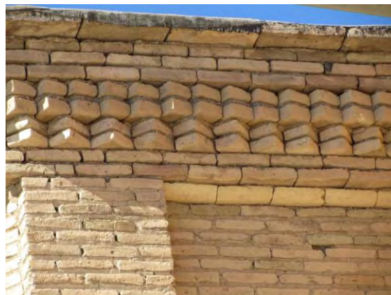
تصویر شماره (۱۳) آجر کاری دیوار های قلعه صمصام السلطنه شلمزار

تزئینات آجری در قلعه شلمزار کم به کار رفته است و بیشترین تزئینات در این مورد را می توان به نمای جبهه غربی بنا اشاره کرد. وستوری بالای در انبار در انتهای نمای جنوبی. تصویر شماره (۱۳)