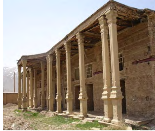
تصویر شماره (۱) نمایی از قلعه شلمزار