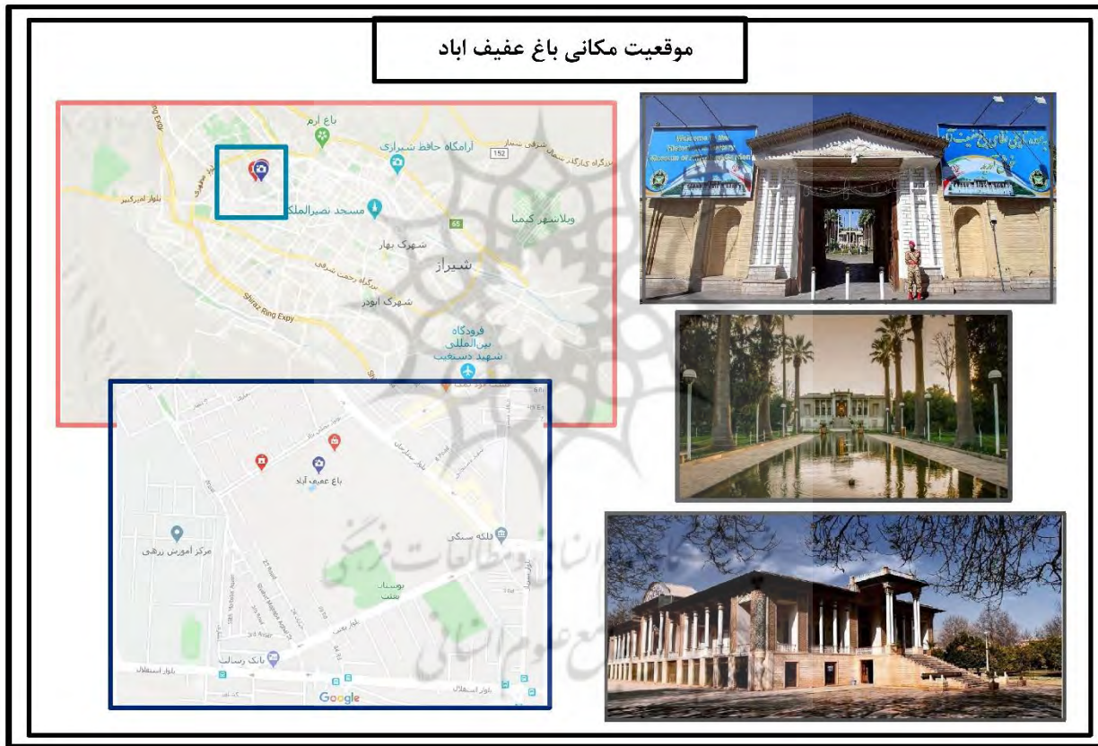
نقشه شماره ۳- نقشه موقعیت مکانی باغ عفیف اباد(ماخذ:نگارندگان)

باغ گلشن که آن را عفیف آباد نیز نامیده اند باغ وسیعی است این باغ از از قدیمی ترین باغ های شیراز است که در دوران صفویه بنا شده که بانی آن میرزا علی محمدخان قوام الملک است که عمارتی شکوهمند دارد . جلوی عمارت حوض بسیار وسیعی است با لبه سنگی و از آنجا تا دیوار شرقی فضایی است که وسط آن آبنا است با گل کاری و سرو و کاج و چنار. (علی تقی،۱۳۴۹) این باغ در محله عفیف آباد در بلوار ستارخان شیراز جای گرفته است و هم اکنون در اختیار ارتش قرار دارد و یک موزه سلاح در آن برقرار است.