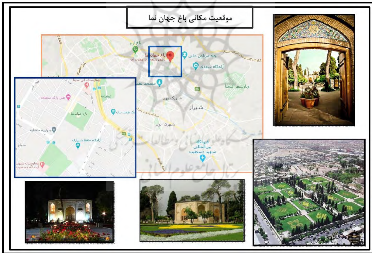
نقشه شماره ۲- نقشه موقعیت مکانی باغ جهان نما

باغ جهان نما قدیمی ترین باغ، شهر شیراز محسوب می شود. خوشبختانه باغ جهان نما نزدیک به ورودی شهر شیراز و در منطقه ای ویژه است. در خیابان های اطراف این باغ مکان های بسیاری برای بازدید از جمله آرامگاه حافظ، هفت تنان، دروازه قرآن، خواجه کرمانی، بابا کوهی، باغ ملی، گهواره دید، کتابخانه ملی اسناد و... وجود دارد. این باغ با مساحت ۸/۲ هکتار دارای ۳۵۰۰ متر مربع فضای سبز است. عمده فضای سبز جهان نما را درخت های تنومند و کهن سرو و نارنج، شمشاد سبز، زهف رنگ، بنفشه، اطلسی و گل های داوودی تشکیل می دهد. این عمارت هشت ضلعی دارای چهار شاه نشین و اتاق های دو طبقه ای است که در میان شاه نشین ها واقع شده است. پنجره های چوبی این باغ بعد از مرمت و بازسازی توسط مالک خصوصی آن جای خود را به پنجره های آهنی داده است. عمارت وسط این باغ مربوط به دوره ی زند است. خیابان کشتی های اطراف عمارت ذکر شده به همراه درختکاری های زیبا در سال ۱۱۸۵ هجری قمری به دستور کریم خان زند انجام گرفت. (سایت خبری تیتراشهر) در وسط باغ عمارتی به شکل کلاه فرنگی قرار دارد که از بناهای وکیل الرعایا (کریم خان زند) است. ساختمان کلاه فرنگی به شکل هشت ضلعی و همانند کلاه فرنگی باغ نظر ساخته شده است. در وسط شاه نشین یک حوض مرمر یکپارچه ساخته شده و چهار شاه نشین در چهار گوشه ی آن تعبیه شده است. (علی تقی، ۱۳۴۹)