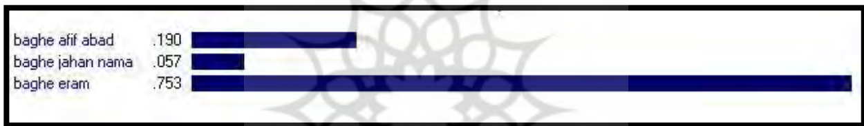
نمودار شماره ۲: نمودار نتایج نرم افزار expert choice