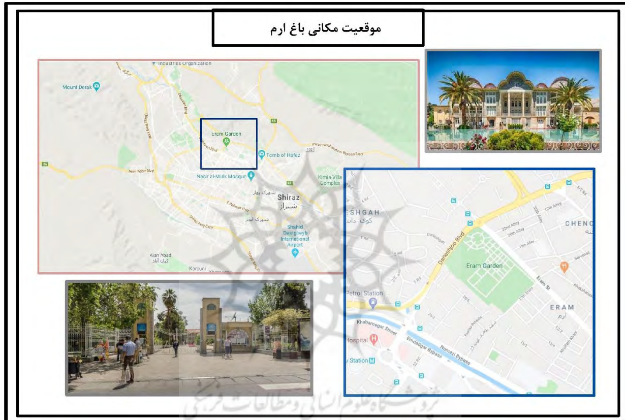
نقشه شماره ۱- نقشه موقعیت مکانی باغ ارم

باغ ارم شیراز در استان فارس و شهر شیراز قرار دارد این شهر در جنوب غربی ایران می‌باشد. محدوده جغرافیایی شهر شیراز از شمال به شهر مرودشت و شهر اردکان، از جنوب به شهرستان جهرم، شهرستان فیروزآباد و شهرستان فسا، از سمت شرق به شهر استهبان، شهرستان نی ریز و شهرستان ارسنجان محدود می‌شود. مساحت این شهر ۸۹۱/۱۷۸ کیلومتر مربع است. در شمال شهر شیراز کوه‌های زیبایی مشاهده می‌شوند که بر زیبایی و عظمت شهر می‌افزایند. اگر به خیابان ارم در قسمت شمال غربی شهر شیراز بروید، در دامنه کوه و در فاصله دو یا سه کیلومتری کوه باباکوهی می‌توانید مشهورترین باغ ایران را ببینید. باغ ارم شیراز آنچنان که در سندهای تاریخی بیان شده در سال ۱۳۲۵ در خارج از شهر شیراز بنا شده و در آن زمان محدوده اطراف باغ شامل بیابان سنگلاخ و رودخانه می‌شده است. با گذشت زمان و در طی سال‌ها، شهر شیراز گسترش پیدا کرده و امروزه این باغ در داخل شهر شیراز و در قسمت شمال غربی این شهر قرار گرفته است. محدوده امروزی باغ ارم در شمال شهر شیراز است و از نظر جغرافیای شهری می‌توان گفت که محوطه آن از شمال غربی به خیابان دانشجو (خیابان آسیاب سه تایی)، از شمال شرقی به بلوار ارم و سرانجام از راس شمالی به میدان ارم محدود می‌گردد (سایت همگردی، سایت جامع گردشگری، ایرانگردی و جهانگردی)