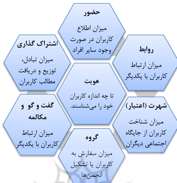
شکل ۱. چارچوب لانه زنبوری رسانه‌های اجتماعی (برگرفته از کیتزمان، سیلوستر و مک‌کارتی، ۲۰۱۲، ص. ۲۴۳)

هویت محدوده‌ای را نشان می‌دهد که کاربران میزان هویت خود را در فضای رسانه‌های اجتماعی آشکار می‌کنند. گفت‌وگو و مکالمه نشان می‌دهد تا چه میزان کاربران در محیط رسانه‌های اجتماعی با یکدیگر ارتباط برقرار می‌کنند. اشتراک‌گذاری نشان‌دهنده مقدار محتوایی است که کاربران آن را مبادله کرده، توزیع نموده و یا دریافت می‌کنند (کاپلان و هنلین ۱ ، ۲۰۱۰). منظور از «ارتباط» این است که دو یا چند کاربر به نحوی معاشرت کنند که منجر به گفت‌وگو و اهداف اجتماعی مشترک شود. حضور بیانگر این است که تا چه حد کاربران می‌توانند بدانند آیا کاربران دیگر قابل دسترس می‌باشند یا نه (عقیلی و قاسم‌زاده عراقی، ۱۳۹۴). شهرت و اعتبار از جنس اعتماد است و گروه‌های آنلاین می‌توانند مشابه باشگاه‌های دنیای آفلاین باشند (پارنت، پلانجر و بل ۲ ، ۲۰۱۱).