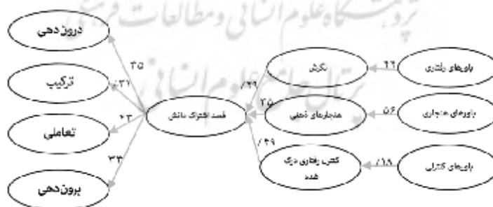
نمودار ۲. الگوی اولیه معادله ساختاری پژوهش (ضریب‌های مسیر)

الگوی ساختاری به وسیله نرم‌افزار لیزرل نسخه ۸/۵ و برپایه ماتریس کواریانس که ورودی برنامه به شمار می‌آید، تخمین زده شد. ضریب‌های مسیر الگوی پیشنهادی و مقادیر در نمودارهای ۲ و ۳ نشان داده شده است.