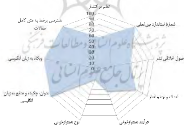
نمودار ۲. نمودار راداری میزان رعایت معیارهای پایگاه‌های نمایه‌سازی توسط مجله‌های انگلیسی‌زبان دانشگاه تهران

پاسخ پرسش ۳: موانع و مشکلات احتمالی پیوستن مجله‌های انگلیسی‌زبان دانشگاه تهران به نمایه‌های بین‌المللی از نظر دسترسی برخط چیست؟ برای نمایش و تحلیل به‌ترتیب داده‌های جدول، نمودار رادار (نمودار ۲) طراحی شده است. این نمودار براساس درصد فراوانی پاسخ «مثبت» مجله‌ها به هر شاخص به دست آمد. پژوهشگران استفاده از نمودار رادار را به این دلیل تجویز کرده‌اند تا بتوانند در طرح‌های پژوهشی آینده تغییرات مجله‌های انگلیسی‌زبان دانشگاه تهران را از نظر چندین معیار با یکدیگر مقایسه کنند. نمودار ۲ نشان می‌دهد از نظر معیار دسترسی برخط، مجله‌های دانشگاه تهران بهترین وضعیت را دارند. تمام مجله‌های مورد بررسی شاخص‌های وبگاه انگلیسی، دسترسی به متن کامل مقاله‌ها، اطلاعات کتاب‌شناختی و چکیده به انگلیسی، منابع به خط لاتین را رعایت کرده‌اند. همچنین در تمام مجله‌ها، امکان دسترسی به آرشیو مجله فراهم شده است. از دیگر ویژگی‌های مهمی که مجله‌ها در این قلمرو رعایت کرده‌اند، اختصاص یوآرال مجزا به قالب اچ تی ام ال و پی دی اف هر مقاله‌شان است. همچنین، نمودار رادار زیرنقطه ضعف اساسی مجله‌های انگلیسی‌زبان دانشگاه تهران یعنی نداشتن نوع و فرایند هم‌ترازخوانی را مشخصاً نمایش داده است.