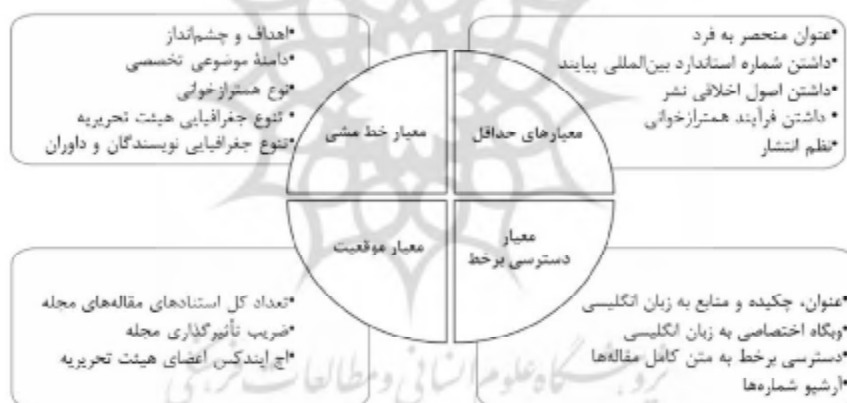
شکل ۱. قلمروهای اصلی داوری برای رد یا پذیرش مجله‌ها در نمایه‌های استنادی وب آو ساینس و اسکاپوس

گزینش آنها برای درج در پایگاه‌های استنادی بین‌المللی بالا برود. معیارهای نمایه‌سازی پایگاه‌های استنادی بین‌المللی در شکل ۱ معرفی شده‌اند. در روند پیوستن مجله به نمایه‌های استنادی گام ارائه اطلاعات دقیق درباره مجله (عنوان، شماره استاندارد بین‌المللی پبایند، محل انتشار، اولین سال انتشار، اعضای هیئت تحریریه و اطلاعات تماس آنها) ست (روی و هلند ۱ ؛ ۲۰۱۲؛ روی ۲۰۱۵؛ تستا ۲ ؛ ۲۰۱۵). در پژوهش «نوروزی و عبدخدا» (۱۳۹۰) درباره استفاده از عنوانی که بازنمون موضوع مجله تأکید شده است. اطلاعات کلی مربوط به هر مجله باید به سهولت در وبگاه مجله برای عموم قابل شناسایی باشد. علاوه بر این، در پژوهش‌های بسیاری درباره وجود رابطه میان کیفیت راهنمای نویسنندگان و کیفیت مجله تأکید شده است (سلامت، صبحانی و ملائی ۲ ؛ ۲۰۱۳؛ گاسپارین و دیگران ۳ ؛ ۲۰۱۴؛ عباس پور، میرزاییگی و زینلی ۴ ؛ ۱۳۹۵).