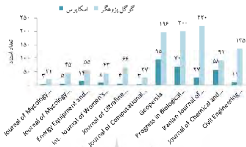
نمودار ۳. ردیابی اسنادهای هریک از مجله‌های انگلیسی‌زبان دانشگاه تهران در اسکاپوس و گوگل پژوهشگر