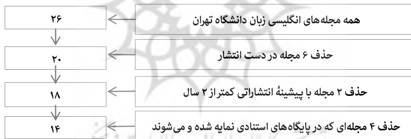
شکل ۲. روند انتخاب نشریات انگلیسی‌زبان دانشگاه تهران برای اجرای پژوهش

بازیابی شد (مجله‌های Iranian, International Journal of Environmental Research, Economic Review و Journal of Sciences Islamic Republic of Iran) که از جامعه پژوهش حاضر حذف شدند (در جدول ۱ با علامت تیک در ستون نمایه در اسکاپوس مشخص شده‌اند). همچنین برای یافتن مجله‌های نمایه شده در وب‌آو ساینس در نمایه‌های ISI، ISI، ISI، ISI و ISI با کلید واژه UNIV TEHRAN جستجو شد. یک مجله انگلیسی‌زبان دانشگاه تهران (International Journal of Environmental Research) در نمایه ISI یافت شد که ضریب تأثیر آن در جی‌سی‌آر محاسبه می‌شود و یک مجله (Iranian Journal of Management Studies) در نمایه منابع نوظهور درج شده است و در مرحله ارزیابی وب‌آو ساینس قرار دارد. بنابراین، این دو مجله هم از جامعه پژوهشی حذف شد (در جدول ۱ با علامت تیک در ستون نمایه در وب‌آو ساینس مشخص شده‌اند). در شکل ۲ تمام مراحل ذکر شده به‌طور خلاصه نمایش داده شده است.