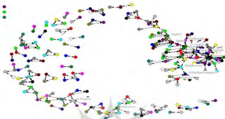
تصویر ۱. شبکه هم‌تألیفی پژوهشگران علم اطلاعات و دانش‌شناسی در فصلنامه کتابداری و اطلاع‌رسانی

نشان‌دهنده درجه مرکزیت یا تعداد هم‌تألیفی آن گره است. ۱۰ نویسنده برتر دارای بیشترین تعداد هم‌تألیفی، در تصویر شماره ۱ مشخص شده‌اند.