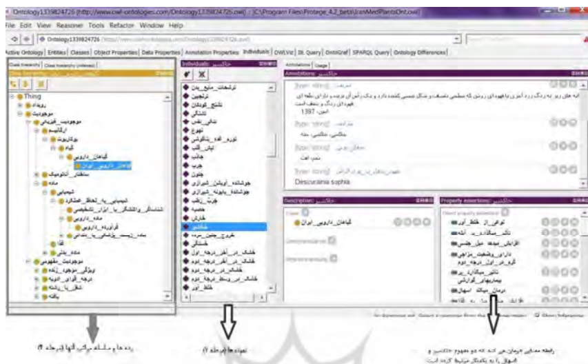
شکل ۱. بخش رده‌ها و نمونه‌ها در هستی‌شناسی IranMedPlantsOnt

۵. توصیف ویژگی‌های رده‌ها و روابط ۱ : اطلاعات ارائه شده در رده‌ها به هیچ عنوان کافی نیست. به همین منظور، قسمت ویژگی‌ها به روابط مورد نیاز در هستی‌شناسی اختصاص می‌یابد و ارتباط بین رده‌ها از این طریق ایجاد می‌شود. در این پژوهش، قسمت ویژگی‌ها و روابط در نرم‌افزار پروتزه با روابط معنایی شبکه معنایی نظام زبان واحد پزشکی و روابط معنایی مستخرج از متون تکمیل شد. روابط به طور کلی به سه دسته روابط شیء ۲ ، روابط نوع داده ۳ و روابط تفسیری ۴ تقسیم می‌شوند (صنعت‌جو و فتحیان، ۱۳۹۱). شکل ۲، قسمتی از این روابط را نشان می‌دهد. در این شکل، روابط شیء نشان داده شده است. رابطه «مفهوم معادل در یو.ام.ال.اس» نوعی رابطه نوع داده و رابطه «نیز ببینید» مثالی از روابط تفسیری است. از این روابط برای توصیف رده‌ها و نمونه‌ها استفاده شد. در کل ۲۱ رابطه معنایی در این پژوهش شکل گرفت.