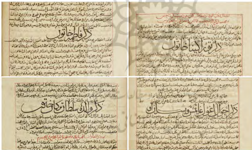
تصویر ۲: ذکر خاتونان، تاریخ جهانگشای جوینی، نسخه محفوظ در کتابخانه ملی پاریس (SUPPL Pers, 205).