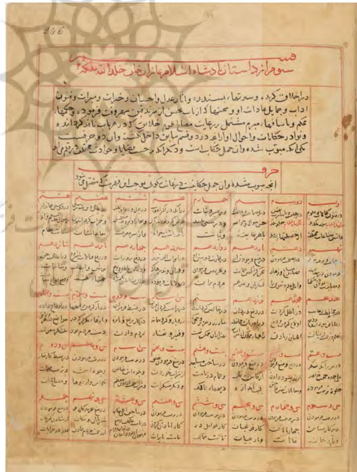
تصویر ۳: برگی از جامع التواریخ، مربوط به اصلاحات غازانی، محفوظ در کتابخانه ملی پاریس (113.1513, SUPPL.).

در این مجلد، خواجه رشید شرح دقیقی از خاتونان غازان خان ارائه می‌دهد (همان، ۱۴-۱۵) و در ادامه، تمامی اقدامات و اصلاحات ساختاری غازان خان را شرح می‌دهد که البته خود او نیز در انجام این اصلاحات نقش بلافصلی داشته است.