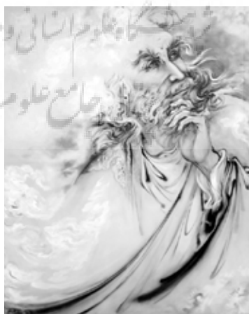
تصویر ۱: عنوان اثر: «حافظ» (Farshchian 1991, 71) طبقه موضوعی: ادبی تکنیک اثر: اکریلیک بر روی مقوای بدون اسید، خیس در خیس ابعاد اثر: ۲۷ × ۴۴/۵ - زمان خلق اثر: ۱۳۶۱