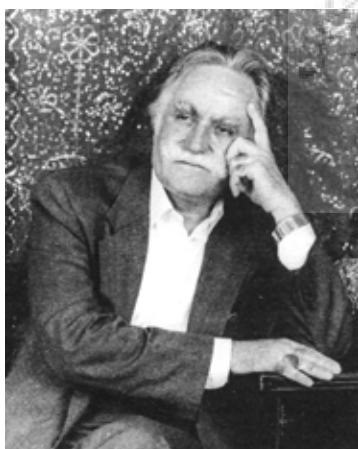
تصویر ۲: چهره نقاش (فرشچیان) (رضائی نبرد ۱۳۹۶، بایگانی‌ها)

به هر روی، موضوع نگاره «حافظ» که با محوریت شخصیت حافظ است، ملهم از ادبیات شیرین و فاخر فارسی است و به‌مناسبت کنگره جهانی بزرگداشت حافظ ساخته شده است. این اثر علاوه بر طبقه «ادبی» در گروه «اجتماعی» و «تاریخی» نیز درج شده است. طبقه ادبی در مجموع با تعداد ۱۳۴ اثر و ۲۴/۹۰ درصد از مجموع آثار هنرمند (۵۳۸) در رده سوم جدول قرار گرفته است.