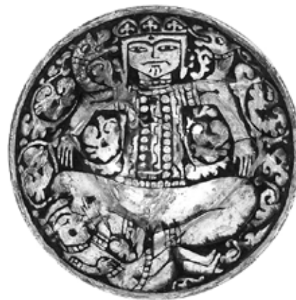
تصویر ۱: کاسه نقش‌کنده با تصویر ضحاک، شیخ تپه ارومیه، قرن ۵ هجری، موزه ملی ایران (کریمی و کیانی ۱۳۶۴، ۱۶۳)