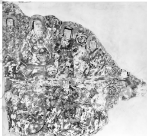
تصویر ۹: قطعه‌ای از دیوارنگاره، ری، قرن ۶ یا ۷ هجری، موزه هنر هاروارد (www.harvardartmuseum.org)

مصنوعات بسیاری (به‌ویژه قطعات کاشی) از سده هفتم هجری به‌جای مانده که دارای کتیبه‌ای حاوی یک یا چند بیت از اشعار شاهنامه‌اند - همگی با تصاویر نامرتبط - که این حاکی از فراگیر شدن تدریجی اشعار شاهنامه و محبوبیت آن در سطح عمومی بوده است. بنا بر نظر آدامووا قدیمی‌ترین نسخه شناخته‌شده از شاهنامه (نسخه فلورانس با تاریخ ۶۱۴ هجری) - که البته غیرمصور است - درست مربوط به همین دوران است (هیلن براند ۱۳۸۸، ۱۱۳). به هر