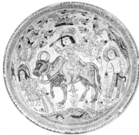
تصویر ۵: کاسه مینایی، احتمالاً کاشان، اواخر قرن ۶ اوایل قرن ۷ هجری، موزه هنری دیترویت (www.dia.org)