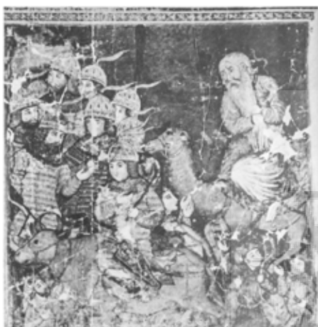
تصویر ۱۱: بخشی از یک نگاره از شاهنامه بزرگ مغولی، ایران، اوایل قرن ۸ هجری، کتابخانه چستربیتی دویلین (Arberry 1959)

اما شاید مهم‌ترین گواه بر تأثیرپذیری بازنمایی‌های مذکور از شاهنامه، ناهماهنگی بین متن و تصویر در نگاره‌های شاهنامه‌های اولیه ایلخانی (اولین نسخه‌های مصور از شاهنامه) مربوط به نیمه اول سده هشتم هجری است. این نگاره‌ها موضوعات مختلفی از روایت فریدون و ضحاک را ارائه می‌دهند: «سپردن فریدون به گاوچران توسط مادرش»، «کوبیدن فریدون گرز را بر سر ضحاک»، «بردن فریدون ضحاک را به کوه دماوند»، «زنجیر کردن فریدون ضحاک را به کوه دماوند» و... و علی‌رغم اینکه در کنار متن قرار گرفته‌اند و طبیعتاً باید از متن پیروی کنند، اغلب در برخی از جزئیات با متن تفاوت دارند. مثلاً در تصویر ۱۱ که نگاره‌ای متعلق به شاهنامه بزرگ مغولی است، فریدون به‌مانند تصاویر آثار سفالی و فلزی، گرز بر دوش و سوار بر گاو نشان داده شده است.