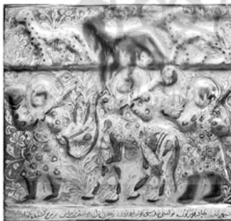
تصویر ۱۰: کاشی زرین‌فام، کاشان، قرن ۷ هجری، مجموعه کورکیان، موزه والترز (www.thewalters.org)

دلیل دیگر را می‌توان در کاشی مستطیلی موجود در گالری هنری والترز پی جست (تصویر ۱۰). روی این کاشی تصویر فریدون سوار بر گاو و دو شخص ناشناس (م احتمالاً سربازانی که فریدون را در بردن ضحاک به دماوند همراهی می‌کردند) دیده می‌شود. حاشیه پایینی تصویر با یک کتیبه شعر از شاهنامه (ابیات یازدهم و دوازدهم از دیباچه داستان بیژن و منیژه) تزیین شده است. ۱۱ باید گفت علی‌رغم ناهمخوانی متن کتیبه و صحنه تصویرشده، این اشعار، ارتباط و پیوستگی روحی هنرمند با اشعار شاهنامه را نشان می‌دهد.