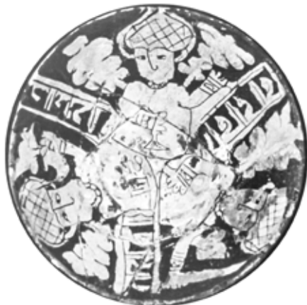
تصویر ۲: کاسه نقش‌کنده با تصویر ضحاک، شیخ تپه ارومیه، قرن ۵ هجری، موزه ملی ایران (کریمی و کیانی ۱۳۶۴، ۱۶۳)