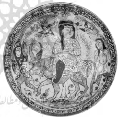
تصویر ۷: کاسه مینایی، احتمالاً کاشان، اواخر قرن ۶ اوایل قرن ۷ هجری، مجموعه کی‌یر (Grube 1976, 200)