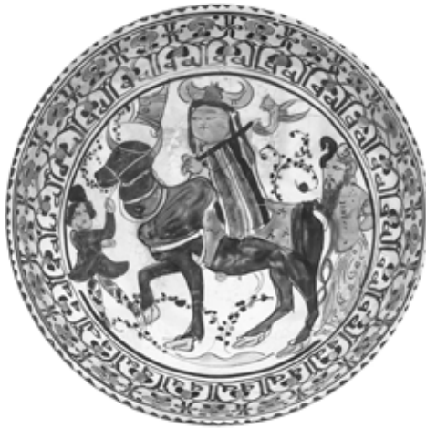
تصویر ۶: کاسه مینایی، احتمالاً کاشان، اواخر قرن ۶ اوایل قرن ۷ هجری، گالری هنر دانشگاه ییل (artgallery.yale.edu)