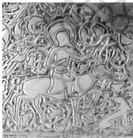
تصویر ۴: بخشی از یک شمعدان برنجی با تصویر فریدون سوار بر گاو، ایران یا عراق، اوایل قرن ۸ هجری، موزه متروپلیتن (www.metmuseum.org)