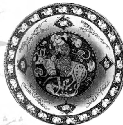
تصویر ۳: کاسه زرین‌فام با تصویر فریدون سوار بر گاو، کاشان، اوایل قرن ۷ هجری، موزه هنرهای صناعی لایپزیگ (Schulz 1914)

نکته‌ای که بد نیست به آن اشاره کنیم، نقوشی است که زمینه تصویر را پر کرده‌اند مانند گیاهان، پرندگان، برکه آب و ماهی‌ها. این آیگون‌ها در آثار سده‌های ششم و هفتم هجری، مواردی نیستند که فقط از جریان روایت پیروی کنند یا جزء خاص یک تصویر باشند. این‌ها عناصر نامرتبلی هستند که از سنت تصویرسازی آن دوران پیروی می‌کنند و معمولاً در همه تصاویر حضور دارند و کمکی به بازشناسی موضوع نمی‌کنند. کتیبه خطوط نیز از این قاعده پیروی می‌کند.