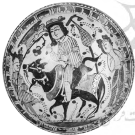
تصویر ۸: کاسه مینایی، احتمالاً کاشان، اواخر قرن ۶ اوایل قرن ۷ هجری، مجموعه هاروی ب. پلوتنیک (Pancaroglu 2007, 112)