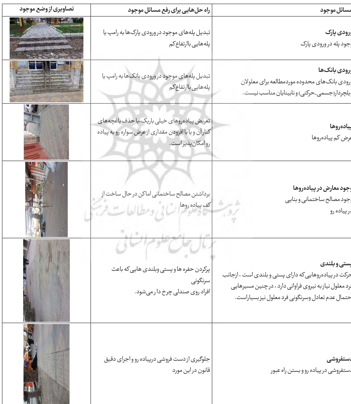
جدول شماره 12: مسائل وضع موجود و ارائه راه حل هایی برای مناسب سازی بخش مرکزی شهرداری