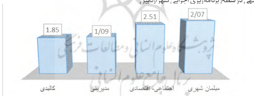
تصویر شماره ۲: نمودار میانگین رضایت‌مندی از گویه‌های تحقیق

براساس یافته‌های به دست آمده در پاسخ به پرسش تحقیق که میزان رضایت‌مندی معلولان جسمی-حرکتی و نابینایان و کم بینایان براساس مؤلفه‌های مناسب‌سازی در شهر اردبیل به چه میزان است؟ می‌توان بیان نمود که براساس نتایج حاصل از آزمون t تک نمونه‌ای میزان رضایت‌مندی این قشر از افراد جامعه کمتر از حد متوسط (۳) است. همان‌طور که در تصویر شماره ۱۱ نشان داده شده، میانگین معیارهای کالبدی، مدیریتی، اجتماعی-اقتصادی و مبلمان شهری به ترتیب (۱/۸۵) - (۱/۰۹) - (۲/۵۱) - (۲/۰۷) است. با توجه به یافته‌ها کمترین میزان مربوط به معیار مدیریتی است. براساس این پژوهش اگرچه تاکنون تلاش‌های مدیریتی و کارشناسی شایان توجه، در سطح برنامه‌ریزی اجرایی، شهر اردبیل،