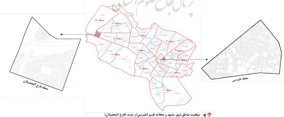
تصویر شماره ۲: معرفی نمونه‌های مطالعاتی