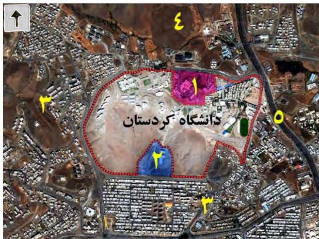
تصویر شماره ۲: موقعیت و همجواری های دانشگاه کردستان

۱- بیمارستان تأمین اجتماعی ۲- دانشگاه پیام نور ۳- محلات مسکونی ۴- دانشگاه علوم پزشکی ۵- محور اصلی شهر (بلوار پاسداران)