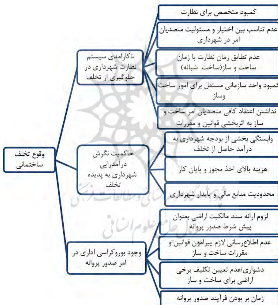
تصویر شماره ۱: مدل تحلیلی پژوهش

برای تدوین مدل تحلیلی پژوهش، علل مطرح در وقوع تخلفات ساختمانی در کشور براساس مبانی نظری و پیشینه جمع‌بندی شد و با بررسی اکتشافی اولیه به صورت مصاحبه با مدیران و کارشناسان شهرداری مناطق سه گانه شهر یزد، مدل تحلیلی پژوهش تدوین گردید که براساس آن «وجود بوروکراسی اداری در امر صدور پروانه و نگرش درآمدزایی شهرداری به مقوله تخلف و ناکارآمدی سیستم نظارت شهرداری منطقه ۳ یزد در جلوگیری از تخلف» متغیرهای تأثیرگذار بر وقوع تخلف ساختمانی در این محدوده قلمداد شده‌اند (تصویر شماره ۱) و از طریق فرضیات تدوین شده، صحت آن مورد بررسی قرار می‌گیرد.