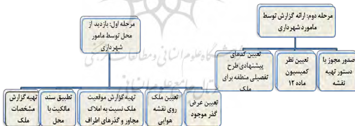
تصویر شماره ۲: مراحل صدور پروانه ساختمانی در منطقه ۳ شهر یزد

با تشکیل پرونده و تعیین وقت بازدید، امر صدور پروانه طی دو مرحله اصلی «بازدید از ملک» و «ارائه گزارش» به وسیله مأمور شهرداری به شرح تصویر شماره ۲ انجام می‌شود. با شروع عملیات ساختمانی و ضمن بازدید و تأیید دوره‌ای مهندس ناظر، مأموران