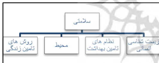
تصویر شماره ۱: نمودار عوامل تعیین‌کننده سلامتی

سازمان جهانی بهداشت (WHO) لیست ابتدایی برای سلامت پیشنهاد کرده که شامل: آزادی از جنگ، فرصت‌های برابر برای همه، ارض شدن نیازهای ابتدایی (غذا، تحصیلات، آب سالم و بهداشتی و مسکن مناسب) امنیت شغلی و نقش اجتماعی مفید، اراده سیاسی و حمایت اجتماعی و عمومی. این واضح است که میزانی از توجه به ابعاد، اجزا و فاکتورها در مراحل مختلف زندگی ارزش‌های متفاوتی دارد. با این تعاریف سلامت فردی در خانه‌های سالم و محیط سالم به دست می‌آید (Boleyn & Honari, 2005). مدل‌های متفاوت توصیفی و مرتبط برای تشریح ارتباط متقابل بین سلامتی و کلیت محیط (زیستی، کالبدی، اجتماعی و اقتصادی) توسعه یافته‌اند. تصویر شماره ۱ به ترسیم روابط میان عوامل تعیین‌کننده سلامتی، با توجه به متون مربوط به سازمان بهداشت جهانی که به خوبی مستندسازی شده‌اند، کمک می‌نماید.