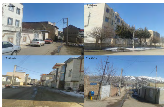
تصویر شماره ۳: وضعیت واحدهای مسکونی مناطق مورد مطالعه

۴.۲. قدمت واحدهای مسکونی: مطابق جدول شماره ۴ از مجموع واحد مسکونی مورد بررسی قرار گرفته در چهار منطقه شهری اردبیل، تعداد زیادی از واحدهای مسکونی دارای قدمت بین پنج تا ۱۰ سال (۳۱,۲ درصد) و تعداد کمی از واحدهای مسکونی دارای قدمت کمتر از پنج سال (۱۰,۰ درصد) هستند. حدود ۲۱,۹ درصد از واحدهای مسکونی دارای قدمت بین ۱۰ تا ۱۵ سال و حدود ۱۲,۱ درصد از واحدهای مسکونی دارای قدمتی بین ۱۵ تا ۲۰ سال هستند و در آخر حدود ۲۴,۸ درصد از واحدهای مسکونی دارای قدمتی بیشتر از ۲۰ سال هستند.