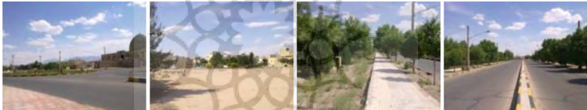
تصویر شماره ۴: مرکز محله پشت سیلو