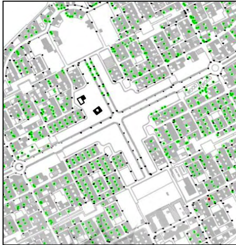
تصویر شماره ۳: بافت نوده و فضا در مرکز محله پشت سیلو