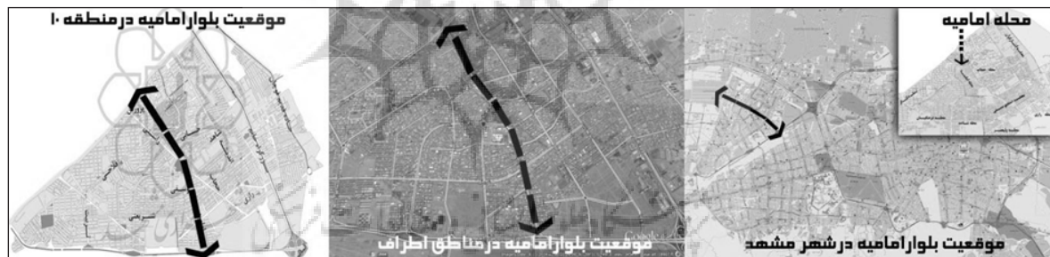
تصویر شماره ۱: موقعیت بلوار امامیه مشهد در شهر و منطقه ۱۰ شهرداری

به منظور دستیابی به میزان ارتباط معنی‌دار میان پارامترهای سنجیده شده در روش پرسشنامه از آزمون آماری "گای اسکویئر" استفاده شده و نتایج زیر به دست آمده است. مقدار فاصله معنی‌داری بین (۰-۰۰۵) فرض شده است.