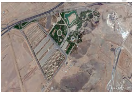
تصویر شماره ۱: پارک بزرگ شهر (بالا) و پارک کوهستانی یزد (پایین)

محدوده پارک کوهستانی یزد به وسعت تقریبی ۱۵ هکتار در اراضی جنوبی شهر یزد و در شرق جاده یزد-تفت و جنوب جاده کمربندی اردکان-مهریز واقع شده است. وجود ارتفاعات با چشم‌اندازها و مناظر طبیعی و همچنین اراضی پست حاشیه این ناهمواری‌ها