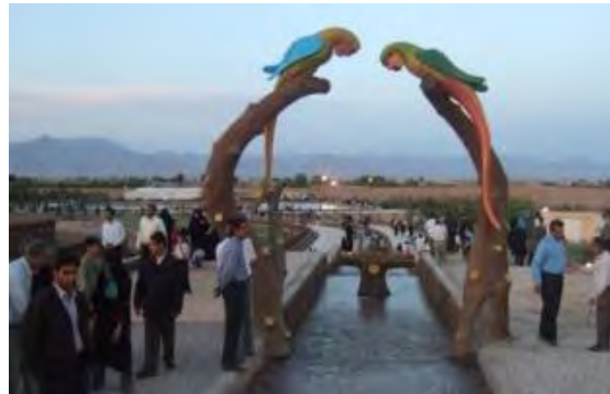
تصویر شماره ۲: پارک بزرگ شهر یزد (تصویر بالا) و پارک کوهستانی شهر یزد (تصویر پایین)