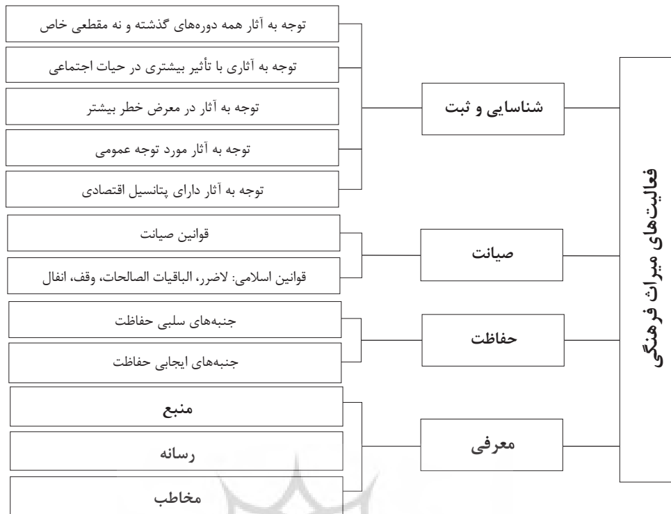
نمودار ۱: انواع فعالیت‌ها در حوزه میراث فرهنگی