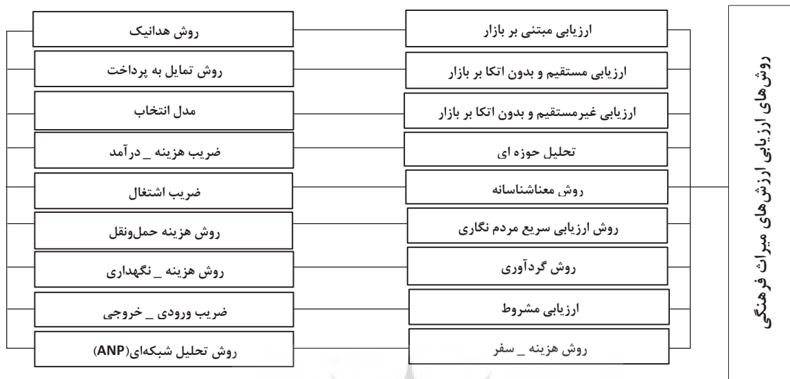
نمودار ۳: روش‌های مختلف ارزیابی ارزش‌های میراث فرهنگی (Abbaszadeh et al, 2013: 215)

مختلف ارزیابی ارزش‌های میراث معماری و شهرسازی در قالب نمودار ۳، پس از معرفی محدوده مورد مطالعه به توضیح روش مورد نظر این پژوهش اشاره می‌شود.