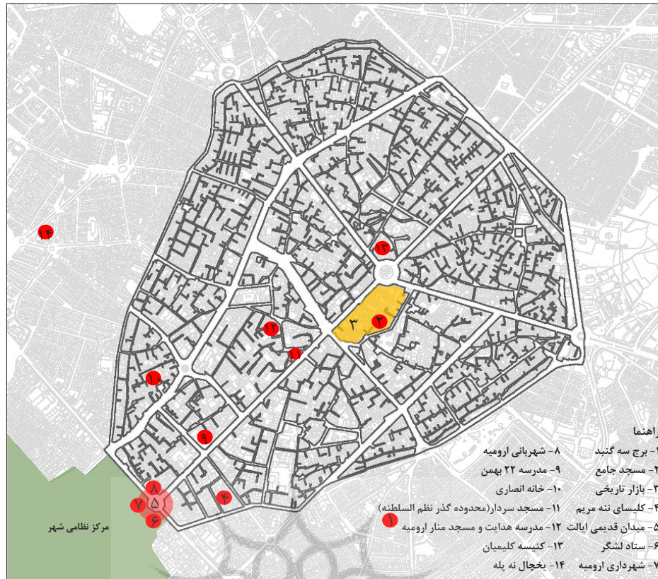
نقشه ۱: محدوده بافت تاریخی و مکان‌های میراثی ثبتی محدوده مرکزی ارومیه

مسائل پیچیده دارد (Zebardast, 2010:79)، مورد نظر این پژوهش قرار گرفته و شامل مراحل زیر می‌باشد: