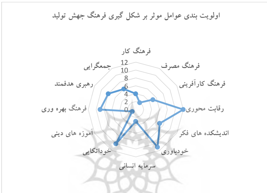
شکل ۱. اولویت‌بندی عوامل موثر بر شکل‌گیری فرهنگ جهش تولید

اولویت‌بندی عوامل موثر بر شکل‌گیری فرهنگ جهش تولید بر اساس میانگین فازی زدایی شده عوامل در مرحله دوم نظرخواهی تعیین می‌شود. نتیجه بررسی و اولویت‌بندی صورت گرفته در قالب نمودار به شرح شکل ۱ است: