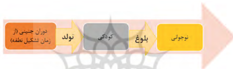
شکل ۲. مراحل کودکی در جامعه ایران، جهان اسلام و میثاق اسلامی حقوق کودک

در جامعه ایران و نظام اسلامی که شامل جهان اسلام و میثاق حقوق کودک نیز می‌شود، از زمان تشکیل نطفه تا ۱۸ سالگی است. همان‌طور که در قوانین و مقررات ایران نیز آمده است (آرتیدا و تقی‌زاده، ۱۳۹۱؛ شعبان، ۱۳۹۹)، کودکی شامل دو بخش کودک و نوجوان است که هر دو در برابر دیگری خود یعنی بزرگ‌سالی قرار می‌گیرند (شعبان، ۱۳۹۹) و نیز هر دو مرحله کودکی با نگاه نسبی‌گرایانه، تعریف و حقوق مختص به خود را دارند، اما در کل، روح حقوق حاکم بر دو دوره در ذیل فضای کلی کودکی، یکسان است و شامل نداشتن مسئولیت جدی و قطعی، نیاز به حمایت و سهل‌گیری است. همچنین دو موضوع تولد و بلوغ دو گلوگاه مهم در دوران کودکی به‌شمار می‌روند که عرصه کودکی را به سه مرحله تقسیم می‌کنند.