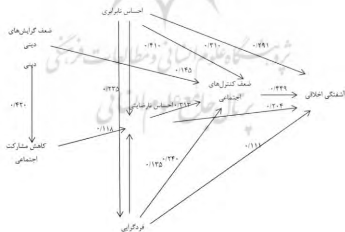
شکل ۲- نمودار مسیر آشفتگی اخلاقی