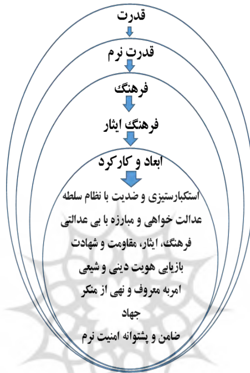
نمودار ۳: رابطه قدرت نرم و فرهنگ ایثار