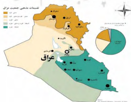
نقشه تقسیمات مذهبی جمعیت عراق

یکی از بارزترین ویژگی‌های جمعیتی این منطقه ترکیب جمعیتی آن است. نوجوانان و جوانان بیشترین درصد جمعیت جنوب عراق هستند و بیش از ۳۰ درصد جمعیت این منطقه را نوجوانان و جوانان تشکیل می‌دهند. در سال‌های اخیر نفوذ آمریکا در عراق بیش از پیش بوده است. انتخاب نوجوانان و جوانان مستعد عراقی و اعزام آن‌ها به آمریکا با هدف آموزش و تربیت آن‌ها جهت پیشبرد اهداف آمریکا در عراق یکی از مهم‌ترین سیاست‌های این کشور بوده است.