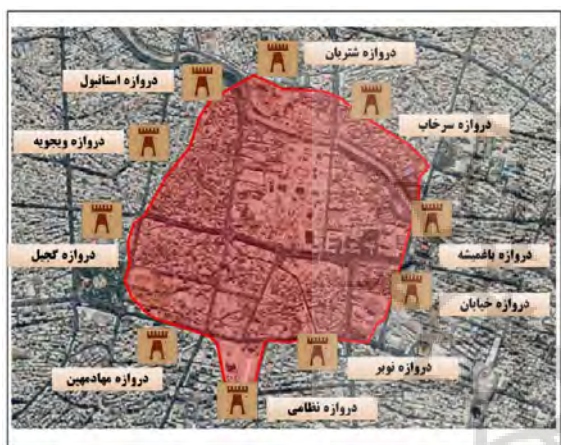
تصویر ۲: موقعیت حصار و دروازه‌های تاریخی آن