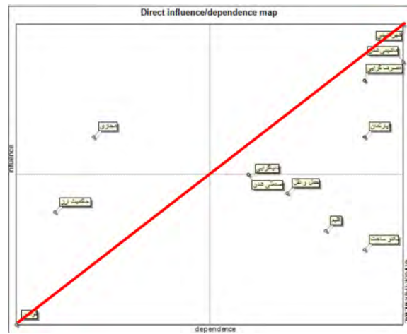
تصویر ۳: پراکنش روندهای جاری در بافت تاریخی شهر تبریز در پلان تأثیرگذاری و تأثیرپذیری

همان‌طور که در بررسی‌های نرم‌افزار تحلیل ساختاری میک مک نیز مشخص شد از مجموع دوازده روند جاری در بافت تاریخی شهر تبریز، چهار روند (روند مسائل شهرنشینی، روند زندگی ماشینی، روند مصرف‌گرایی و روند توسعه آپارتمان‌نشینی) بیشترین اهمیت را داشتند و به‌عنوان عامل کلیدی پیشران، شناسایی شدند که وضعیت‌های مختلف این روندها در واقع شاکله اصلی در تدوین سناریوهای آینده موردنظر است. در این مرحله، آینده‌های باورکردنی بر اساس عوامل راهبردی و کلیدی شناسایی شده در سه سناریو: سناریوی اول خوش‌بینانه و طلایی، سناریوی دوم بدبینانه و فاجعه‌آمیز و سناریوی سوم ادامه وضع موجود و محتمل، تبیین شده‌اند. در این مرحله از سناریونگاری از متخصصانی که در مرحله ارزیابی روابط و تأثیرات روندهای بافت تاریخی شهر تبریز مشارکت داشته‌اند، از پنج نفر، درخواست شد در قالب مصاحبه‌های عمیق، سناریوهای سه‌گانه شهری خود را با توجه به نتایج به‌دست‌آمده از نرم‌افزار میک مک و