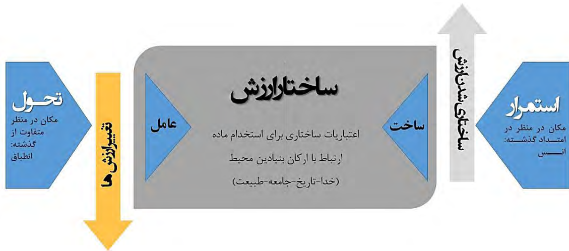
تصویر ۲: نسبت استمرار و تحول با ساخت و عامل در ساختار ارزش (Saba 2020)