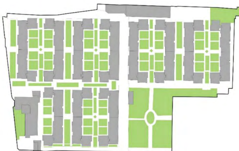
تصویر ۲: مجتمع چمران (نمونه ۱) Fig. 2: Chamran Complex (Sample 1)

(تصویر ۲) در قالب بلوک‌های سه تا پنج طبقه طراحی شده است، محصور است و ورودی و خروجی کنترل شده دارد. این مجموعه یک فضای سبز عمومی، زمین ورزش، تعداد ساختمان معدودی تجاری روزانه، و مسیر پیاده تعریف شده دارد و در عین حال چیدمان بلوک‌های آن به گونه‌ای است که حیاط‌هایی نیمه خصوصی بین آن‌ها ایجاد شده است. مساحت محدوده ۵۴۲۵۰ مترمربع است و ۳۳۱ واحد مسکونی در آن قرار دارد. ۶ رسالت، (تصویر ۳) منطقه‌ای مسکونی است که در آن آپارتمان‌های سه تا هشت طبقه در