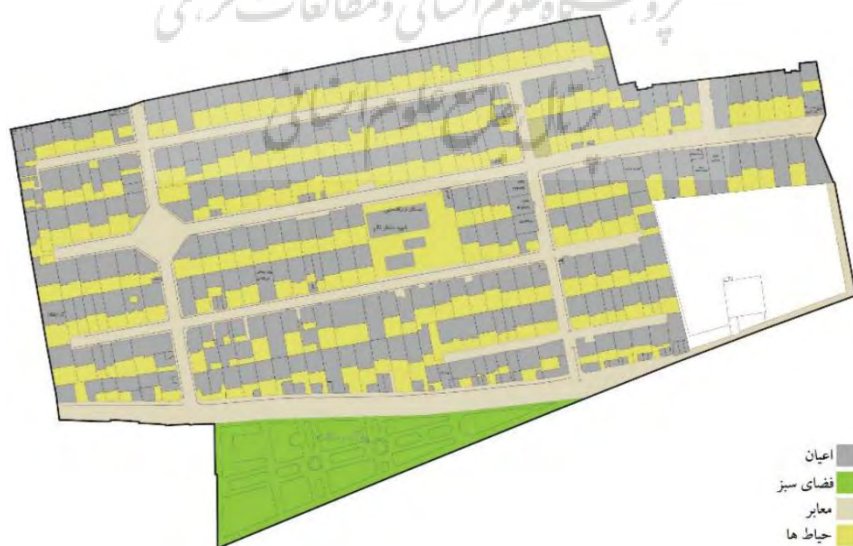
تصویر ۳: محدوده رسالت (نمونه ۲) Fig. 3: Resalat Restrict (Sample 2)

(ج) نمونه‌ها: از آنجا که تحقیقات (Koohsari et al. 2012; Wood 2006; Kang 2006) توصیه کرده‌اند که وضعیت اقتصادی اجتماعی نمونه‌ها (با توجه به تأثیر آن‌ها بر سرمایه اجتماعی) مشابه باشد، بنابراین تلاش شد تا نمونه‌های انتخابی نزدیک به یکدیگر و در یک ناحیه شهری باشند و در همان حال محیط کالبدی آن‌ها متفاوت باشد. بر این اساس مجتمع مسکونی شهید چمران و کوی برنجی (رسالت) ۹ در شهر تبریز که فاصله اندکی با یکدیگر دارند (۶۰۰ متر) به عنوان نمونه‌ها انتخاب شدند. مجتمع چمران