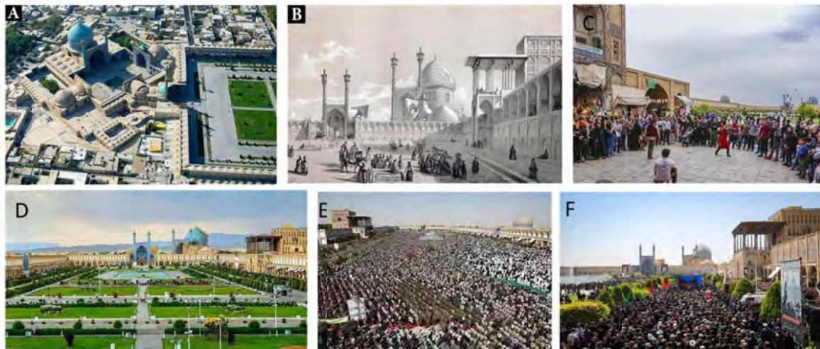
تصویر ۱: مجموعه نقش جهان: A- مسجد امام (شاه)، B- میدان در دوره قاجاریه؛ C نقالی یا داستان‌سرایی در میدان؛ D عرصه میدان؛ E برگزاری نماز جمعه در میدان؛ F برگزاری مراسم عزاداری امام حسین (ع) در ماه محرم در عرصه میدان