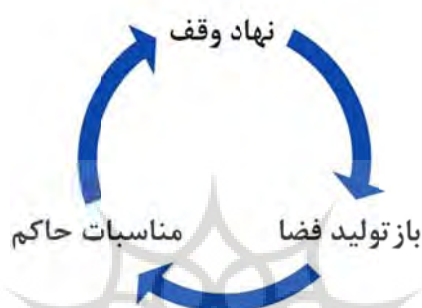
نمودار ۲: الگوی تکوین شهر اسلامی مبتنی بر فرهنگ وقف Chart 2: The pattern of Development of the Islamic city based on the culture of Waqf

همراه بوده است، موجب استمرار و ساخت‌یابی این نظام‌های شهری بوده است، نظام‌های شبکه‌واری که تمامی نظام شهری را در گستره محلی، منطقه‌ای و فرا منطقه‌ای، به یکدیگر ارتباط می‌داد و با تکیه بر همان نهاد وقف آن ساختارها را تا عصر حاضر تداوم و استمرار بخشیده‌اند. فرایند تکوین شهر اسلامی مبتنی بر فرهنگ وقف و الگوی انتزاعی آن در جدول شماره ۸ و همچنین نمودار ۲ نشان داده شده است.