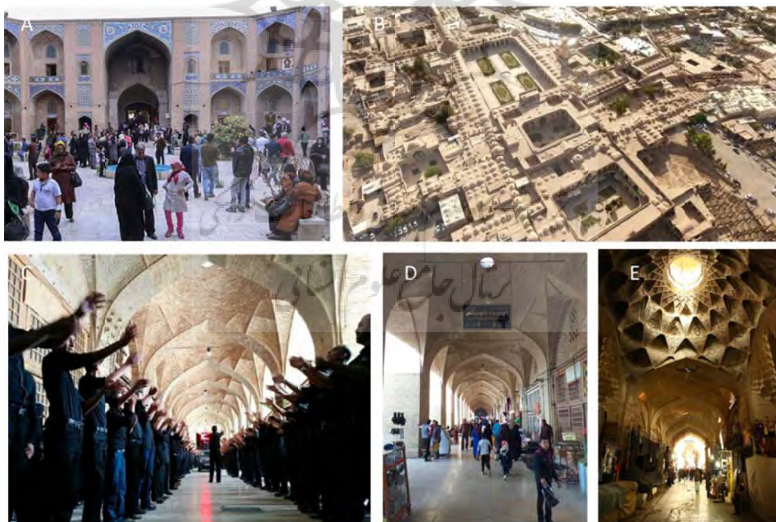
تصویر ۲: معرفی مجموعه گنجعلی‌خان - A کاروان‌سرا (مدرسه)؛ - B دید پرنده از مجموعه؛ - C برگزاری مراسم عزاداری محرم در بازار؛ D بازار اصلی (راسته بازار گنجعلی‌خان)؛ E چهارسوی بازار

واقف برای تحقق عدالت اجتماعی و توزیع مجدد درآمد در سطح شهر کرمان توأمان با تقویت ارزش‌های اجتماعی، رفتاری و اخلاقی و منع یا تحریم ارزش‌های منفی در کنار ارائه خدمات رفاهی در مناسبت‌ها و اعیاد مذهبی هم‌زمان با اجرای مراسم گوناگون اجتماعی در میدان و حمایت از بنیان