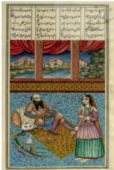
تصویر ۴. ملاقات رستم و تهمینه، شاهنامه عمادالکتاب، کاخ موزه گلستان. منبع: (فردوسی، ۱۳۷۷)

برخلاف تصویر ۱ از روایی و شهرت عمومی برخوردار نیست که در نگاه نخست متن ادبی را یادآوری کند. خاصه آنکه براساس نص شاهنامه این ملاقات در شب هنگام و در نور شمع ندیمه همراه تهمینه رخ می‌دهد اما فضاسازی نگاره، روز روشن را تداعی می‌کند. با این حساب در این نگاره، نشانه‌های تصویری شمایل رستم بیش از پیش به کار می‌آیند؛ او که در اینجا کلاه از سر برداشته، با سر طاس، سیل بلند تا بناگوش، ریش دوفاقی، چشمان درشت و مخمور و البته نگاه خیره و عاری از احساس مجسم شده است. به رسم حضور وی در فضای داخلی، خبری از رخس نیست. او شمشیر، تیر، کمان و کلاهخودش را به کنار بستر خویش نهاده و هرچند از ادوات جنگی، خنجر، کمنده، سپر و... و از پوشش آن، زانوبند و ساق‌بند ندارد اما با ببریان و ساعدبند نقش شده است. به واقع هرچند نقاش این امکان را داشته که به دلیل نمایش رستم در حال استراحت در فضای خانگی از تجسم کلاهخود دوشاخ دیوسر، تیر و کمان صرف‌نظر کند یا وی را با پوششی جز ببریان به تصویر درآورد اما با تجسم چنین نشانگانی، بازشناسی او را سهولت بخشیده است. شاید حضور تیر و تیردان، کمان، شمشیر و ساعدبند را بتوان به هر جنگاوری نسبت داد و ویژگی‌های چهره‌شناسی مردانه مذکور را به تمام صور مردان قاجاری تسری بخشید اما چهره میانسال، ریش دوفاقی، کلاهخود دوشاخ دیوسر و ببریان کار را در شناسایی رستم به عنوان مرد لمیده حاضر در تصویر تمام می‌کنند، نشانه‌هایی که بیش از متن ادبی، متعهد به سنت‌های تصویری پیشین هستند چراکه در این تصویر فقط می‌توان ببریان را نشانه شاخص برآمده از ادبیات شاهنامه دانست و می‌بایست سوابق مابقی را در سنت‌های تصویری متقدم جستجو کرد.