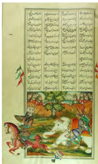
تصویر ۲. جنگ رستم با خاقان چین، شاهنامه عمادالکتاب، کاخ موزه گلستان. منبع: (فردوسی، ۱۲۷۷).

در باب سبک تصویرنگاری نخست قاجاری، چشمان درشت، نگاه تصنعی، ابروهای پرپشت و لبه‌ای برجسته از خصایل چهره‌پردازی مردانه است. «در چنین نقاشی‌هایی که به طور معمول در قطع بزرگ هستند، مردان با ریش بلند و سیاه، کمر باریک، نگاه خیره و یکدست بر شال کمر و دست دیگر بر قبضه شمشیر نمایانده می‌شوند و کوششی برای نمایش خصوصیات روانی آنها مشهود نیست» (پاکباز، ۱۳۸۵: ۱۵۱). البته بسیاری از این ویژگی‌ها به عصر فتحعلی‌شاهی محدود نشد و از ابتدایی‌ترین نمونه‌های پرده‌نگاری این سلسله در عصر فتحعلی‌شاهی تا متأخرترین نمونه‌های کتاب‌آرایی همچون هزارویک شب صنیع‌الملک جایگاه خود را حفظ کرد. هرچند برخی نیز در پرده‌های دوره ناصری رنگ باخت یا در صور نگارگرانه متأخر با جلوه‌های آکادمیک غربی هم‌آمیزی پیدا نمود اما بازهم به عنوان خصایص کلی سبک نقاشی این دوره قابل دفاع است. به عنوان نمونه، سیل بلند و بناگوش دررفته از خصایص چهره‌گشایی مردانه در این دوره است. چنانچه ریش با گذار از دوره فتحعلی‌شاه به دوره ناصرالدین‌شاه، اعتبار خود را از دست داد، موضوعی که در قیاس پرده‌های به جای مانده از این دو پادشاه قاجاری قابل ملاحظه است اما سیل همچنان در شکل بلند و بناگوش دررفته اهمیت خود را حفظ کرد. البته موارد فوق به جهت امکان تجسم در تمامی صور مردانه، شاخصه ویژه‌ای در شناسایی شمایل رستم محسوب نمی‌شوند اما از نشانه‌های تصویری هستند که هرچند تأثیر حضور آنها ملاک عمل نخواهد بود اما فقدان و