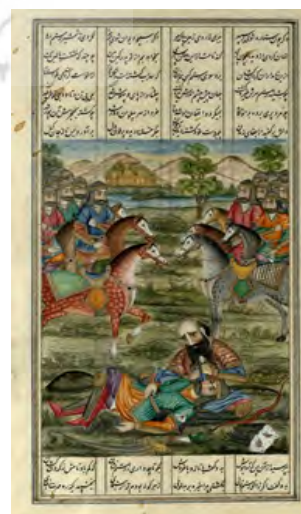
تصویر ۱. رزم رستم و سهراب، شاهنامه عمادالکتاب، کاخ موزه گلستان.