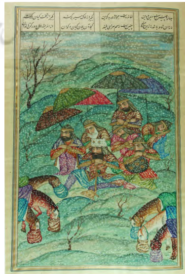
تصویر ۳. گرفتار شدن رستم در برف، شاهنامه عمادالکتاب، کاخ موزه گلستان. منبع: (فردوسی، ۱۳۷۷)

نگاره ملاقات رستم و تهمینه: تصویر ۴، داستانی را نشان می‌دهد که فارغ از جنبه‌های رزمی و جنگاورانه است. در این صحنه ملاقات رستم و تهمینه، دختر شاه سمنگان برای بار نخست جان می‌گیرد. (پیشین، ۲۴۸) صرف نظر از نشانه‌های تصویری حضور رستم در این مجلس، چنین نگارهای می‌تواند هریک از نمونه‌های داستانی مشابه در شاهنامه فردوسی را تداعی کند چرا که این نمونه