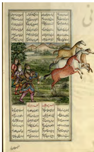
تصویر ۶. رام‌شدن رخس توسط رستم، شاهنامه عمادالکتاب، کاخ موزه گلستان.

نگاره نبرد رستم با دیو سپید: تصویر ۵ براساس خان هفتم شاهنامه با محوریت داستان جنگ رستم و دیو سفید شکل گرفته است (پیشین، ۲۰۶). در این صحنه، رستم در سخت‌ترین لحظه نبرد با دیو سپید که به بیرون کشیدن جگر او منتهی می‌شود، بدون کمند، کمان، تیر و تیردان؛ خنجر را بالا برده و شمشیر را به زمین انداخته است. او در این کارزار سخت، زانویند و ساق‌بند به تن ندارد. اما بازهم در هیبت تنومند که درخور قهرمانان شاهنامه است با چهره‌ای میانسال به سبک پیکرنگاری قاجاری و البته با ریش دوفاق به نمایش درآمده؛ درحالی‌که ببریبیان پوشیده و اسبش، رخس را در گوشه تصویر لگام کرده است. نکته حائز اهمیت آنجاست که وی در جنگ با دیو سپید و لحظه‌ای که هنوز او را از پای درنیاورده، مغفر دوشاخ دیوسر را به سر کرده است. به عبارت دیگر پیش از پای درآوردن دیو سپید، کلاهخود ساختگی از بدن او را بر سر گذاشته تا شناسایی وی با سهولت بیشتری همراه شود. البته مطلب آن نیست که نقاش آگاهانه بر این انتخاب مداومت ورزیده که او نیز شاید به ناگاه و براساس اسلوب صوری نهادین در ذهن، نسبت به چنین شکلی از تصویرسازی مبادرت داشته است. هرچند که براساس متن داستان، رستم پس از بیرون کشیدن جگر دیو، سر او را از بدن جدا نمی‌کند اما سنت حضور این شکل از کلاهخود در شمایل نگاری رستم را به کشته شدن دیو سپید به دست او نسبت داده‌اند. «رمزگان تصویری کلاهخودی از سر دیو برای رستم از سده نهم/ شانزدهم به روایت‌های تصویری شاهنامه راه یافته است» (ماهوان، ۱۳۹۶: ۶). با این حساب وجود آن در حین این کارزار و پیش از دستیافت پیروزی، هم اندازه اهمیت آن به عنوان یک نشانه تصویری در بازنمایی رستم، غریب جلوه می‌کند و تأثیر سنت‌های