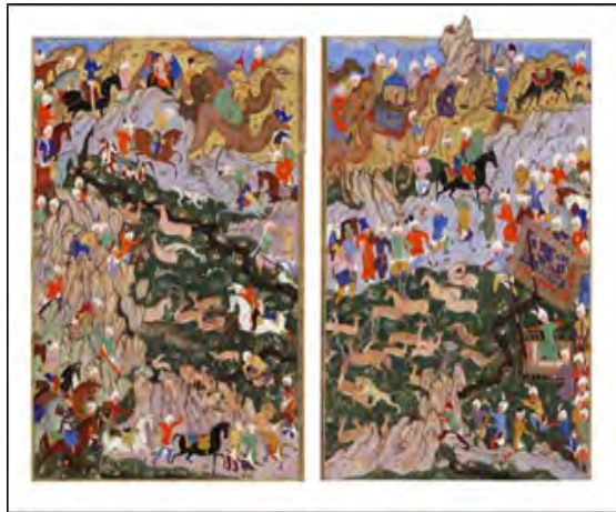
تصویر ۱. شکار سلطنتی، اثر سلطان محمد، ۹۴۷ ه.ق، کتابخانه‌ی ملی سنت پترزبورگ.