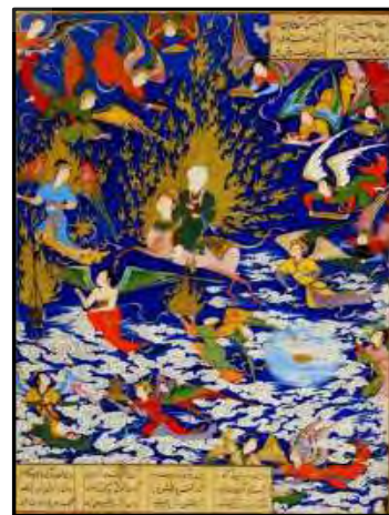
تصویر ۴. معراج حضرت پیامبر، اثر سلطان محمد، ۹۴۶ تا ۹۵۰ تصویر ۵. معراج حضرت پیامبر، ۸۸۶ تا ۹۰۱ ه.ق، موزه هنر دالاس. منبع: (وبگاه موزه هنر دالاس، ۲۰۲۰) تصویر ۶. معراج حضرت پیامبر، اثر عبدالرزاق یا بهزاد، ۹۰۰ ه.ق. منبع: (شین‌دشتگل، ۱۳۸۹: ۱۵۹)