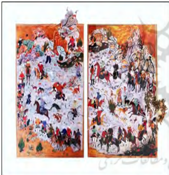
تصویر ۲. شکار سلطنتی، منسوب به بهزاد، ۹۰۲ ه.ق، کتابخانه‌ی موزه‌ی توپقای‌سرای. منبع: (اشرفی، ۱۳۹۶: ۱۶۱)