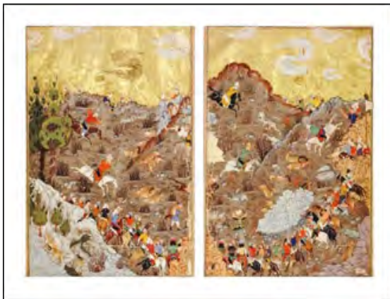
تصویر ۳. شکار سلطنتی اوزون حسن، ۸۶۴ تا ۸۷۴ ه.ق، کتابخانه‌ی ملی سنت پترزبورگ.