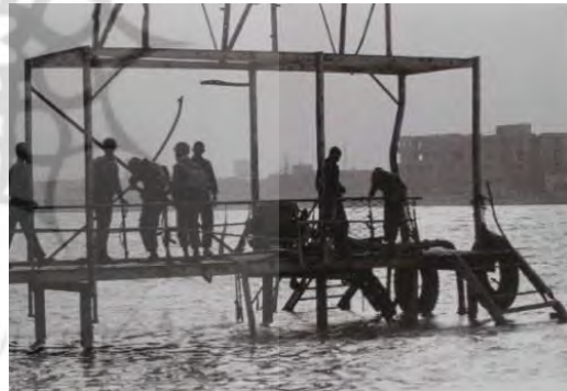
۵-۳۹. رود کارون،. منبع: (جنگ تحمیلی: دفاع در برابر تجاوز، ج. ۸، ۱۳۸۷) ۵-۴۳. حیاط گمرک خرمشهر،. منبع: (جنگ تحمیلی: دفاع در برابر تجاوز، ج. ۱، ۱۳۶۱)