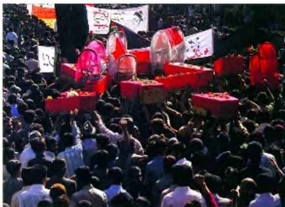
۵-۲۰. تشییع جنازه کودکان خردسال در شهر همدان، محمد فرنود. منبع: (جنگ تحمیلی: دفاع در برابر تجاوز، ج. ۲، ۱۳۶۱)

یکی از دستاوردهای تحلیل محتوای متن، تشخیص جریان‌های معاند متعین داخلی در گیر با حکومت است که با وضوح و با اشارات صریح از آنها نام برده شده است (کومله، دموکرات، مجاهدین و ...) که از تعداد اشارات می‌توان حتی به میزان اهمیت‌شان پی برد؛ مقولاتی که توسط عکس‌ها قابل شناسایی و بازیابی نیستند. از همین دست،