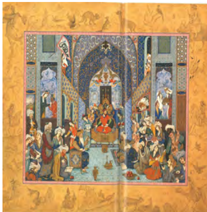
تصویر ۱. ظهور نشانه‌هایی از ژرفنمایی و تلفیق شیوه‌ی نقاشی کلاسیک غرب در کنار سنت نگارگری در تابلوی «فردوسی در دربار سلطان محمود غزنوی»، اثر هادی تجویدی (افتخاری، ۱۳۸۱: ۳۴)