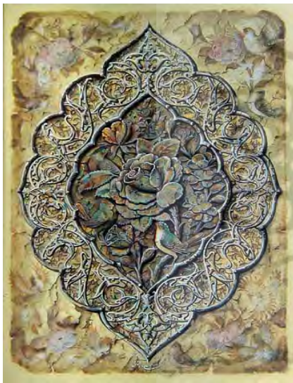
تصویر ۷. نقاشی گل و مرغ با رویکردی جدید اثر حسین علی ماجپانی. منبع: (مرغان تسییح گو، ۱۳۸۱)