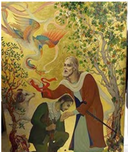
تصویر ۵. بخشی از نگاره رزمنده، همایش انقلاب هنر، محمدعلی رجیبی، ۱۳۹۸.

متخصصان شرکت‌کننده در پژوهش بستگی دارد. شرکت‌کنندگان در تحقیق دلفی از ۵ تا ۲۰ نفر را شامل می‌شوند» (نقیب‌السادات، جوادی، ۱۳۹۰: ۷۱).