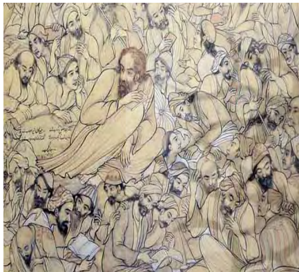
تصویر ۲. طراحی متنوع چهره همراه با شخصیت پردازی و پیکره‌نگاری خاص حسین بهزاد، «آنان که محیط فضل و آداب شدند...» اهدایی استاد بهزاد به سازمان میراث فرهنگی، موزه بهزاد- ۱۳۴۴ (ناصری پور، ۱۳۸۳: ۱۷۴)

نقاشی طبیعت‌گرا بود مینیاتور را زیر نظر استاد خود در بالاترین حد ممکن فرا گرفت و به چنان قدرت و خلاقیتی بخصوص در چهره‌سازی و شخصیت‌پردازی رسید که در نوع خود و تا آن زمان بی‌بدیل شناخته شده است. شاید بتوان داستان و روند معاصر شدن را با مرور آثار این هنرمندان آغاز کرد. اما فراتر از توجه به مفاهیم ساختاری چون ژرف‌نمایی (پرسپکتیو)، سایه‌پردازی و رعایت نسبی اصول کالبدشناسی در آثار بزرگانی چون بهزاد (اصفهانی) و تجویدی (برای اولین بار و یا چهره‌هایی با شخصیتی متمایز) بود که توجه به مضامین عرفانی و داستان‌های ادبی با رویکردی به جنبه‌های اجتماعی روز، نگارگری را به ورطه‌ی هنر معاصر نزدیک‌تر نمود. «استاد بهزاد (اصفهانی) قیافه‌ها و آناتومی ایرانی را جایگزین چهره‌های متحدالشکل و قالبی، مغولی کرد و آناتومی معقول و مناسبی را در مینیاتور به کار برد. او همچنین در انتخاب موضوع ابتکار به خرج داد و موضوعات روز و جریان‌ات فکری زمان خود