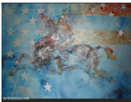
تصویر ۹. کاپیتان ظریف، پیش از فتح آمریکا، گالری ساربان، ۱۳۹۵.