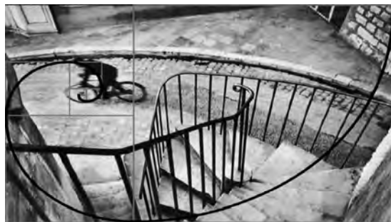
شکل 1. تطابق ماریچچ طلایی یا دنباله فیبوناچی با عکس دوچرخه‌سوار کارتیه برسون مأخذ (Monro, 2019, 12)

کارتیه برسون هندسه را به‌عنوان یک نقاش آموخته بود و برخلاف سایر عکاسان خبری و مستند اجتماعی هم‌زمانش که سوژه را هسته مرکزی عکس خود می‌دانستند، با اهتمام به ترکیب‌بندی به شیء وهی برگرفته از هندسه در نقاشی سوژه را تنها در بافتی هندسی می‌پذیرفت. کارتیه برسون همچنین در سفری که به آفریقا داشت «با یک شکارچی آشنا شد و شکار در شب را از او آموخت،