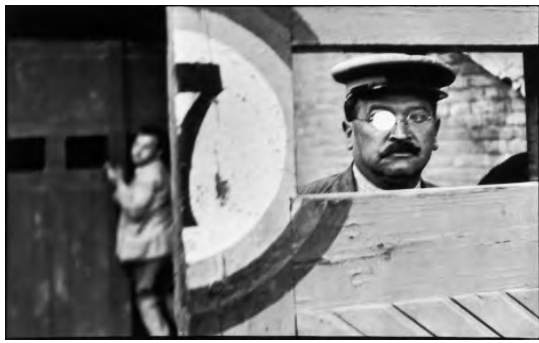
شکل 6. مراسم گاوبازی، 1933، کارتیه برسون.

گاوبازی به دنبال چیزی مشابه قاشقی که آندره برتون و یا ماسکی که جیاکومتی پیدا کرد می‌گشته که با این دو مرد مواجهه شده و در همان آن مواجهه بعد از انتخاب هندسه قاب دکمه شاتر را فشار داده تا آنچه جهان پیش روی او گذاشته از طریق ناخودآگاهش به اثری هنری تبدیل شود.