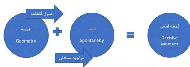
شکل 7. سازوکار دو مرحله‌ای لحظه قطعی، مأخذ: نگارنده

برسون و انطباق آن با دو مؤلفه انیت و مواجهه تصادفی برگرفته از مکتب سوررئالیسم نتایج زیر حاصل شد: