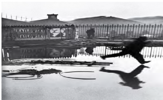
شکل 5. ایستگاه سنت لزر، 1932، کارتیه برسون. مأخذ: www.magnumphotos.com