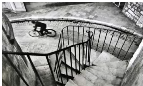
شکل 4. دوچرخه‌سوار، 1932، کارتیه برسون. مأخذ: www.magnumphotos.com

می‌شد. لذا بنابر دو مؤلفه مطرح‌شده از سوررئالیسم؛ مواجهه کارتیه برسون با دوچرخه‌سوار بهترین سوژه برای قاب او در آن روز و در آن زمان بوده که می‌توانسته به خلق اثری هنری برای وی بیانجامد و این مواجهه بر اساس نیاز او از طریق مواجهه یا ابژه‌ای تصادفی برای او رقم خورده و لحظه‌ای که او به‌طور غریزی دکمه شاتر را فشار داده درست‌ترین لحظه برای آشکارسازی واقعیت قاب و بیان درست آن، چراکه او از این طریق به‌واسطه ناخودآگاه خویش لحظه را ثبت کرده است. بنابراین رویه، این عکس ترکیبی از مهارت وی در ترکیب‌بندی هندسی و تلاشش برای ایجاد ارتباط میان ناخودآگاه خویش و جهان بیرون برای بیان شکلی از واقعیت مدنظر وی خواهد بود.