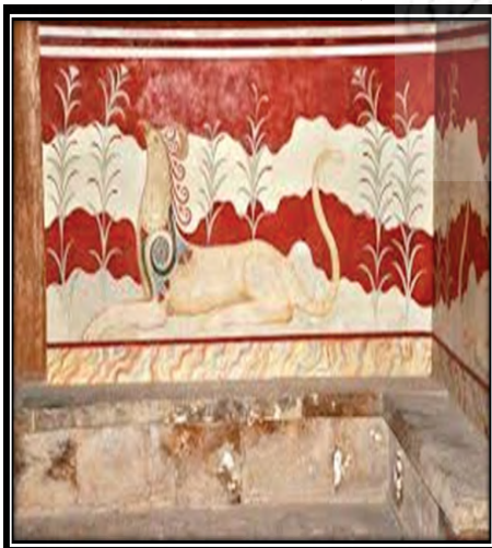
تصویر ۸. نقاشی دیواری با نقش گریفین در تالار سریر کاخ کنوسوس (Anderson, 1950: 122, Lawrence, 1996: 23, Matz, 1962)

و شیردال های متعدد مملو بودند. در مطالعاتی که پیرامون این موضوع انجام گرفته، محققان در مطالعات خود نتیجه گرفته اند که گاو، شاخ گاو و تصویر جهش گاو که در مقابلش یک انسان در حال رقص قرار دارد، از مهم ترین نقش های دیواری کاخ کنوسوس می باشد. گاو و شاخ گاو عمده ترین و اصلی ترین عناصر تزئینی کاخ کنوسوس بوده است. قهرمان گاوبازی ۳۷ که در مقابل این حیوان اسطوره ای در حال حرکت می باشد، مضامین آن منطبق با ستاره های کیهانی است و یکی از منابع اصلی اسطوره ای مینوسی است. بطور کلی، قهرمان گاوباز و صحنه های نمایشی از دوئل گاوهای کی از موضوع های اصلی اسطوره ای مینوسی است (McInery 2009: 7, Charbonneau, 2011: 2, Kallman, 1985: 58, Wiener, 2017: 149-173).