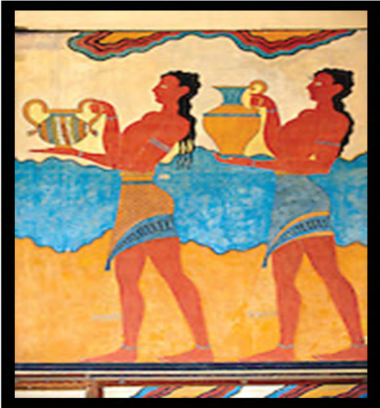
تصویر ۱۱. نقاشی دیواری حاملین جام، انتزاعی (Schneider, 2001: 42)