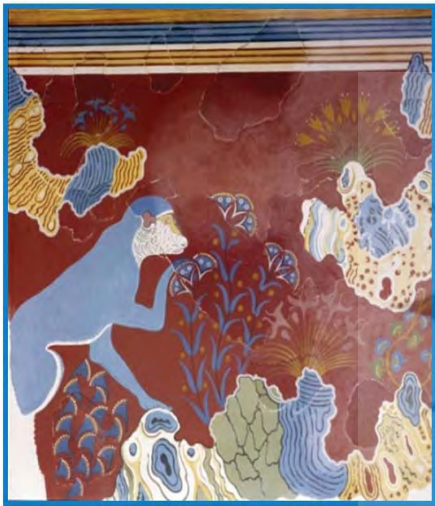
تصویر ۷. دیتیل نقاشی دیواری میمون آبی رنگ بر روی صخره. ۱۵۰۰ پ.م. موزه هراکلیون (Demargen: 20)