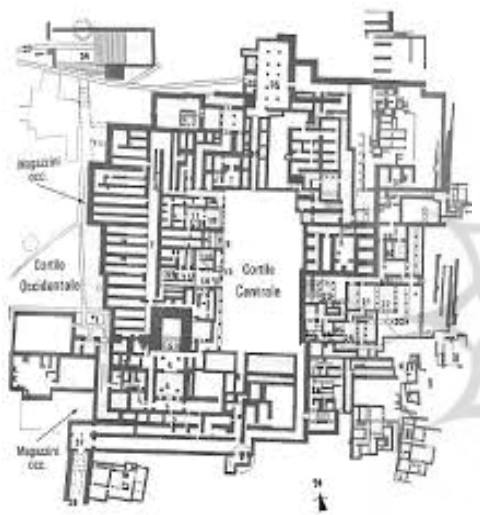
تصویر ۲. نقشه کاخ کنوسوس. ۱۴۰۰-۱۶۰۰ پ.م Schneider, 1984: 78; Honour, 1962: 16, Matz, 2001: 69

کاخ کنوسوس شامل فضای مسکونی، آشپزخانه ها، انبارها، حمام ها، اتاق های تشریفات، کارگاه ها و عبادت گاه های متعدد بود. در این کاخ تأسیسات زیربنائی پیچیده، سیستم های تهویه و مجراهای آب زیرزمینی احداث شده بود. سیستم فاضلاب با لوله های سفالی بوده که یکی از بهداشتی ترین شهرهای جهان تا پیش از سده بیستم است. در انبارهای زیرزمینی، باستان شناسان، عاج فیل حمل شده