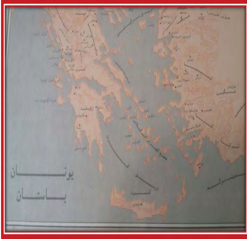
تصویر ۱. موقعیت جغرافیایی جزیره کرت در دریای اژه (دورانت، ۱۳۸۰: ۱).

یونان از سه جهت توسط دریای اژه احاطه شده است. کرت یکی از جزایر عمده یونان می باشد و در بخش جنوبی این منطقه قرار دارد. این جزیره شامل حدود ۲۵ منطقه می باشد که به آن «تمدن اژه ای» ۱۷ می گویند (Chapin 2016: 3). تصویر ۱ موقعیت جغرافیایی کرت را نشان می دهد.