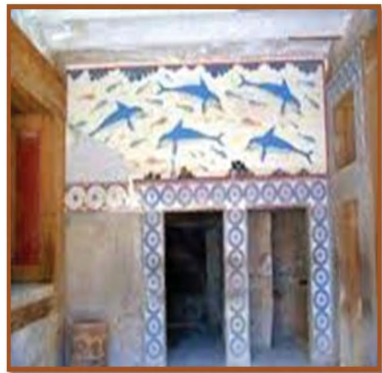
تصویر ۹. دلفین‌ها، مگارون کاخ کنوسوس (آژند، ۱۳۹۰: ۴۱۳)

یکی از معروف‌ترین نقاشی‌های کاخ تصویر پرنده آبی (تصویر ۱۰) است، این پرنده‌ی آبی‌رنگ در میان صحنه بر روی صخره‌ای در