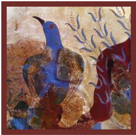
تصویر ۱۰. نقاشی دیواری از پرنده آبی‌رنگ. ۱۵۰۰ پ.م. موزه هراکلیون (Honour, 1984: 78; Demargen: 140). هارت، ۱۳۸۴: ۱۴۰).

دلفین‌های تصویر ۹، به همراه انواع ماهی‌ها بصورت معلق و شناورند. از نظر شاخص‌های وصف و تحلیل، رنگ دلفین‌ها آبی است و چند عدد ماهی کوچک قرمز و زرد نیز در اطراف دلفین‌ها حضور دارند که بنظر می‌رسد دورتر از دلفین‌های جلو صحنه قرار دارند. کمپوزیسیون این کار هماهنگ است. رنگ سرد، غالب می‌باشد (بصورت ناخودآگاه فضای داخل آب دریا را نشان می‌دهد). خطوط موج و منحنی، موج آب را نشان داده‌اند. نحوه قرار گرفتن دلفین‌ها در تابلو بصورت پراکنده است و نه متمرکز. ماهی و دلفین‌های دورتر کوچک‌تر بنظر می‌رسند و به کار حالت پرسپکتیو ۴ داده است. این نوع رنگ‌گذاری، رنگ دلفین آبی و رنگ آب، اوکر متمایل به سفید می‌باشد. به بیان دیگر برعکس واقعیت رنگ‌گذاری شده‌اند، گوئی نقاش هنرمند از پشت شیشه شفاف شاهد صحنه بوده و این نقاشی‌ها و نوع رنگ برآمده از ذهنیت او بوده است.