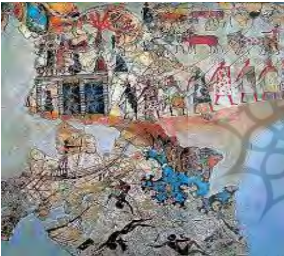
تصویر ۱۲. نقاشی دیواری ساحل و انسان‌ها، کاخ کنوسوس (Schneider 2001: 47)