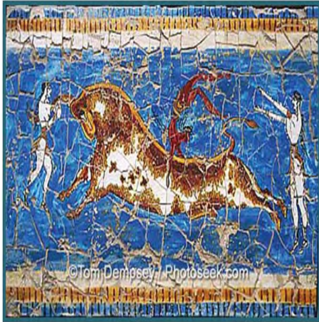
تصویر ۶. نمایش سنتی دوئل گاو. از مشهورترین نقش های فرسکو کاخ کنوسوس. ۱۵۰۰ پ.م. موزه هراکلیون (هارت، ۱۳۸۴: ۱۴۹)، (Schneider, 2001: 70)