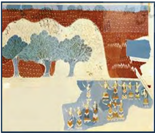
تصویر ۱۳. نقاشی دیواری زنان و درختان، هنرمیتوسی، دیتیل هنرمیتوسی، موزه هراکلیون (Demargen, 140; Minoan Art: 2018)

میان شاخه‌های درختان آماده پرواز و نگاه به آسمان دارد. شاخص‌های وصف و تحلیل بیانگر آن است که رنگ مورد استفاده در این کار از رنگ‌های گرم، سرد و اشباع تشکیل گردیده. نوع بافت از سطوح صاف و گیاهان بصورت انتزاعی کار شده‌اند. نقش پرنده بصورت واقعی است اما نحوه کاربرد رنگ امپرسیونیستی است. یکی از مشخصه‌های نقاشی مینوسی، تمایل به مرکز از نظر کمپوزیسیون است. در مقاله‌ای که توسط شرینگ نوشته شده، نویسنده به این نکته اشاره کرده که مشابه این سبک (مخصوصاً روش رنگ‌گذاری و نوع رنگ و کمپوزیسیون) در کاخ‌های مختلف در بین‌النهرین همچون ماری، یاریم لیم و الخلاخ نیز وجود دارد و مشاهده شده است، به بیان دیگر سبک مینوسی نیز به دیگر فرهنگ‌ها نفوذ و انتقال یافته و متأثر از آنها نیز بوده است. شرینگ در مقاله خود نیز به تبادل فرهنگی میان کاخ‌های ماری و کنوسوس اشاره کرده است (Sheiring, 1993: 189-200).