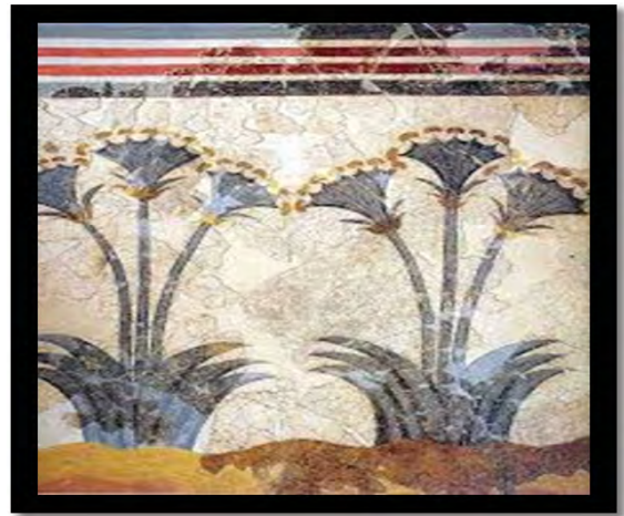
تصویر ۴. نقاشی دیواری مدرن از گل‌های زعفران کاخ کنوسوس (Martino, 2005: 70)

در عصر مفرغ، مذهب کرتی، بت‌دریج پیچیده‌تر گردیده. مثلاً شاهد ظهور خدایان قدرتمند مذکر و به ویژه زئوس کرتی هستیم. خدای باروری که به رغم نامش، از لحاظ روحی به دیونوسوس نزدیک بود. زیرا هر سال می‌مرد و طی جشنواره‌ای مقدس، از نو زائیده می‌شد. زئوس کرتی شکل نرگاو بخودگرفت که نماد ناپوستگی چرخه‌ی تولد، مرگ و رستاخیز بود. این زئوس، کانون جشنواره‌ای موسوم به تیودایسپا بود و در طول آن، شهرها سوگند اتحاد با یکدیگر را تجدید می‌کرده‌اند. این رویدادها شامل رقص نیز بوده که در آن، چنان که به روشنی روی دیوارهای کاخ نشان داده شده، رقصندگان روی نرگاو که به تاخت حرکت می‌کردند، پشتک وارو می‌زدند. در این نقوش هر دو گروه مردان و زنان، پرش انجام می‌داده‌اند. در صحن (عبادتگاه) ایزدبانو، سازه باشکوهی است که دیوارهای این سازه از صحنه‌های مشت‌زنی، دست‌وپنجه نرم کردن با نرگاو،