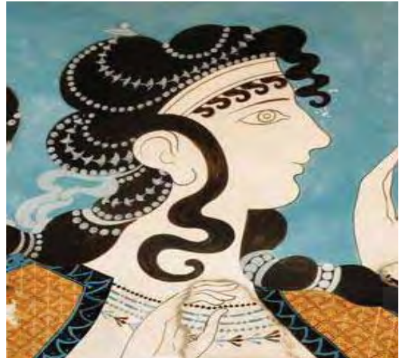
تصویر ۱۴. نیمرخ زن. نقاشی دیواری انتزاعی. هنرمینوسی (Matz, 1962: 117, Demargen: 17)

نشانه‌شناسی گویای آن است که رنگ در این تصویر شامل: آبی، قرمز، سیاه، نارنجی، اوکر و قهوه‌ای است. بافت کار از نوع خشن، نرم، صاف و کمپوزیسیون هماهنگ و متعادل است، خطوط از نوع صاف، منحنی و موج می‌باشند، نوع کار انتزاعی است.