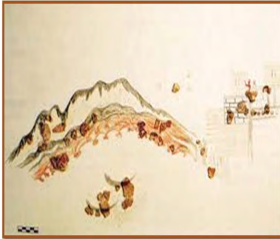
تصویر ۵. نقاشی دیواری از منظره و صخره طبیعی (Alarm-stern, 2014: 380)

بصورت مدرن کار شده. با دیدگاه وصف استفاده از خط و رنگ در حداقل بوده اما بیان کار کامل است. این تصویر به نوعی طراحی-نقاشی محسوب می‌گردد.