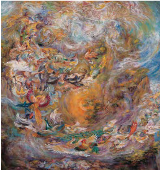
تصویر ۱. «سیمرغ، قاف و سی مرغ»، ۱/۵×۸۱ سانتی متر، ۱۳۹۵ (فرشچیان، ۱۳۹۶: ۱۳۲)

نمادهای متعارف جهانی است که روانشناسی تحلیلی، مبانی عرفانی و رویکرد اسطوره‌ای را عمیقاً به هم پیوند می‌زند. هنرمند در این نگاره به طور کلی اهمیت نماد پرنده و پرواز معنوی را خاطر نشان ساخته است. فرشچیان در نگاره «سیمرغ»، پرنده را به تعبیر هندرسن، مناسب‌ترین نماد تعالی می‌داند (هندرسن، ۱۳۸۹: ۲۲۶).