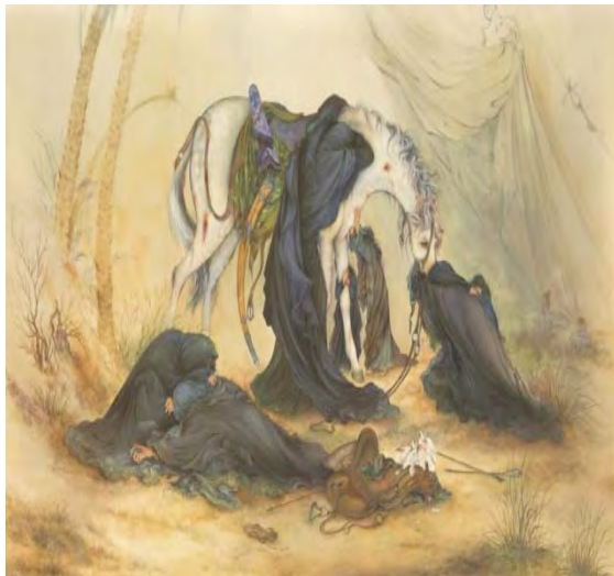
تصویر ۳. «عصر عاشورا»، ۷۳×۹۸ سانتی متر، ۱۳۵۵ شمسی (Farshchian, 1991: 143)