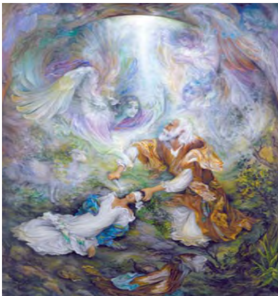
تصویر ۲. «آزمون بزرگ»، ۸۱/۳ × ۱۰۱/۶ سانتی متر، ۱۳۷۶ شمسی (Farshchian, 2004: 200)

به حضرت ابراهیم (ع) است. عناوین این آثار بدین قرارند: «گلستان آتش»، «آزمون بزرگ» (تصویر ۲)، «سخت ترین امتحان»، «حضرت ابراهیم (ع)»، «حضرت ابراهیم (ع) بت شکن»، «توکل» و یک نگاره با اسلوب سیاه قلم. در این میان، نگاره آزمون بزرگ به عنوان نمونه معیار هنر دینی در این پژوهش، پرکارترین اثر از هفت تابلویی است که با محوریت حضرت ابراهیم ساخته و پرداخته شده اند. این اثر، علاوه بر طبقه دینی، در طبقات قرآنی، معنوی، تاریخی، اجتماعی، حماسی، و غنایی نیز جای دارد. طبقه قرآنی در مجموع با تعداد ۴۱ اثر و ۷/۶۲ درصد از مجموع آثار هنرمند (۵۳۸) در رده دوازدهم جدول قرار گرفته است. البته با توجه به معاشرت نزدیک نگارنده با هنرمند و دیگر اسناد مرتبط، جان هنرمند همواره به آموزه های دینی و به ویژه کتاب قرآن به عنوان معیار دین اسلام و شاخص راست اندیشی مانوس بوده است و این تعداد آثاری است که صرفاً و صراحتاً مورد ساخت اثر واقع شده اند. سرچشمه هنر دینی، اسلامی و در این جا هنر ایرانی فرشچیان (آزمون بزرگ)، بی واسطه از معنویت اسلامی و از حقیقت درون قرآن کریم است و نه از متون شرعی. همان گونه که نصر می گوید، هیچ کتاب فقهی ای نیست که به شما دستورالعمل بدهد که مثلاً چگونه مفرنس بسازید، یا چگونه خطاطی کنید (نصر، ۱۳۹۴: ۹۸).