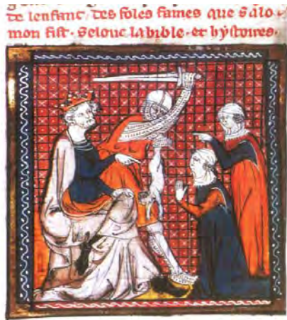
تصویر ۱. یکی از مصورسازی‌های قرون وسطا

در این تصویر مادر دروغین بی‌حرکت ایستاده است و بیش از اینکه درخواست کشتن کودک را بکند حالت ندامت به خود گرفته که با متن صریح آیات همخوانی ندارد و ویرایش نقاش است. سلیمان نیز با برخاستن و فرمان دادن همچنان بلند کردن یکی از