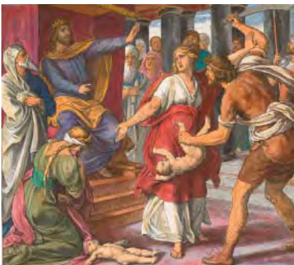
تصویر ۸. فن کارسفلد؛ موزه برلن

دستانش به معنای توقف کنشگر فعالی به خود گرفته است چنانچه سر و نگاه میرغضب نیز به سوی اوست. طرز به دست گرفتن بچه نیز با اغلب دیگر نقاشی‌ها متفاوت است و شدت و خشونت آنها را ندارد. همانطوریکه گفته شد برخی از نقاشی‌ها مانند نقاشی نیکولا پوسن ۶ (۱۶۶۵-۱۵۹۴) محکمه در فضایی کم‌و بیش داخلی برگزار می‌شود. در این نقاشی جبروت و شکوه سلیمان به نمایش گذاشته است. در اینجا مادر واقعی روبه‌روی سلیمان روی زانو افتاده و با دستان گشاده می‌خواهد بچه را نکشد. زن دروغگو نیز بچه مرده که در واقع بچه خودش است را در یک دست گرفته و با دست دیگر بچه زنده را نشانه رفته است (تصویر ۵). تصویر پوسن بسیار مورد توجه منتقدان قرار گرفته است اما به نظر ما از نمونه‌های بسیار خوب در بیان تصویری و انتقال پیام روایی قلمداد می‌گردد. دستان مادر واقعی فقط برای استمدادطلبیدن از سلیمان فعال شده است. در صورتیکه میرغضب بچه را به شکل بسیار خشونت‌باری در دست گرفته و قصد دو نیم کردن آن را دارد. بدن نیمه‌عریان میرغضب نشان از آمادگی وی و خشونت وی برای اجرای حکم را دارد. در این نقاشی وجود یک کودک سوم که مادرش چسبیده و از صحنه وحشت کرده است نیز در میان نقاشی‌های دیگر تقریباً یک استثناست.