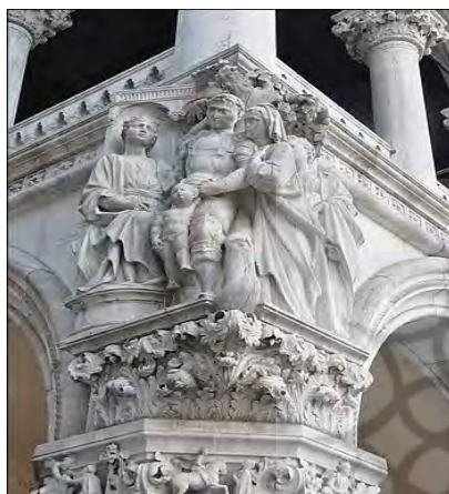
تصویر ۲. قصر دوژها در ونیز