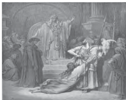
تصویر ۴. موزه ارسنی؛ دوره