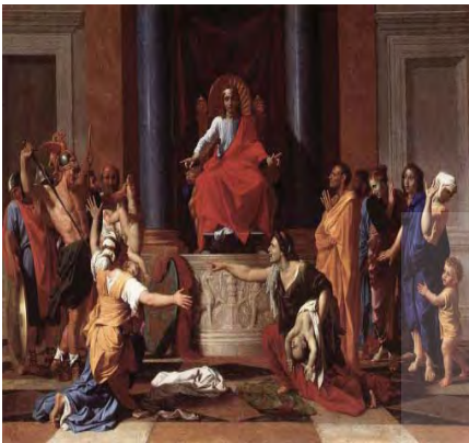
تصویر ۶. موزه لوور