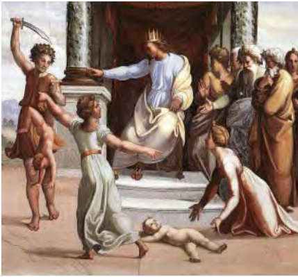
تصویر ۵. واتیکان؛ رافائل