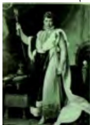
تصویر 2. رابرت نفور، ناپلئون، 1811م (13:1998, Diba)