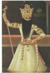
تصویر 6. تصویر فتحعلی‌شاه، مهرعلی، 1224 ه.ق. (آدامووا، 1386: 242)