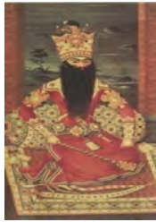
تصویر 7. تک‌چهره نشسته فتحعلی‌شاه، مهرعلی، 1229 ه.ق. رنگ روغن روی بوم 118x253 شماره موزه‌ای 1108 (آدامووا، 1386: 244)

و عصا که در دست ناپلئون دیده می‌شود عیناً در نقاشی مهرعلی تکرار می‌شود. این بخش به نفوذ غرب و گفتمان فرهنگی در دیدگاه فوکو در نقاشی پرداخته می‌شود. در بررسی نظریه فرهنگی فوکو رابطه فرد با جامعه در قدرت و گفتمان مطرح خواهد بود (اسمیت، 1387: 198). این گفتمان قدرت نشانه قدرت و نفوذ اروپایی در ساختارهای فرهنگی اجتماعی و سیاسی ایران در دوران قاجار است که در نقاشی نمودار می‌شود. تأثیرپذیری از فرهنگ غربی در نقاشی قاجار نمودی از تعامل ساده میان فرهنگ ایران و غرب نیست بلکه در وجه غالب نتیجه ورود اروپاییان و جداسدن بخش‌های وسیعی از ایران در دوان قاجار است. ارتباط با غرب در این دوره زیربنای سیاسی و اجتماعی، سمت‌وسوی فرهنگ و هنر نقاشی را مشخص می‌سازد. نقاشی پیکره‌نگاری در دوره اول قاجار به صورت نمادین و برای نشان‌دادن قدرت شاه شکل می‌گیرد. نقاشی به عنوان ابزاری رسانه‌ای برای نمایش قدرت شاه است که با معیارهای ایرانی اروپایی تصویر می‌شود و به کشورهای اروپایی ارسال می‌شود و در واقع از زبان هنر آنان برای ارتباط برقرار کردند در تصویر استفاده می‌کند. این واکنش خارج از مدار قدرت نیست. آنچه در تصاویر 3-7 دیده می‌شود نوع ایستادن، گرفتن عصای شاهی کاملاً توسط فتحعلی‌شاه از ناپلئون بناپارت تقلید و تکرار شده است.