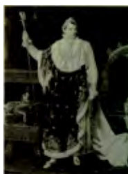
تصویر 1. فرانسس جرالده، ناپلئون 1805م، پاریس (13:1998, Diba)