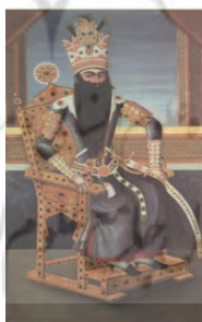
تصویر 4. فتحعلی‌شاه نشسته بر روی صندلی، منسوب به مهرعلی، 1227 ه.ق (182:1998, Diba)