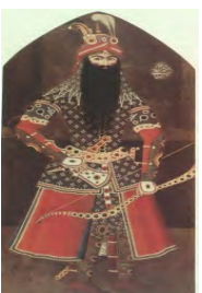
تصویر 5. فتحعلی‌شاه در لباس رزم، مهرعلی، 1223 ه.ق (186:1998, Diba)