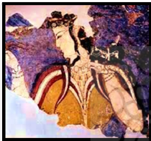
7. نیم‌رخ زن میسنی (Demargen, 19. Schneider, 2001: 73, Matz, 1962: 76, 108. Ibid, 58)

هنرغنی مصر قرار داشتند. با فروپاشی تمدن مینوسی در کرت، تمدن میسنی در یونان 29 برتری می‌یابد. وقوع جنگ‌های متعدد با ساکنان بومی یونان باعث می‌شود تا میسنی‌ها دژها و حصارهای متعددی حول سرزمین خود بنا کنند. این دژها تا 1200 پ.م. آنها را در پناه خود قرار داد (وودفورد، 1386: 37، 36).