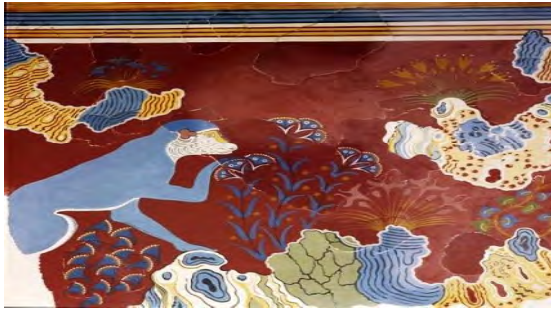
3. دیتیل نقاشی دیواری میمون آبی رنگ بر روی صخره در حال چیدن گل زعفران. 1500 پ.م. موزه هراکلیون (Demargen, 140)