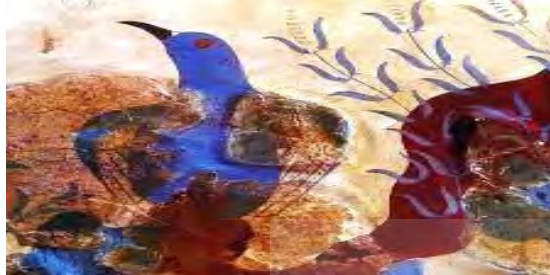
4. نقاشی دیواری از پرند به رنگ آبی. 1500 پ.م. کاخ کنوسوس. موزه هراکلیون (Demargen, 140; Honour, 1984: 78; Hara, 1984: 1384)

نقش بسته‌اند که بیشتر از موضوع هائی مانند منظره و یا موضوع انسانی مشابه کارهای انجام شده در کنوسوس است (Martino, 2005: 4-6).