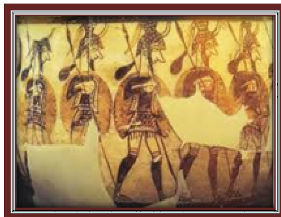
8. جنگجویان میسنی نقاشی شده بر روی جام

با توجه به نتایج آزمون ضریب همبستگی اسپیرمن ملاحظه می‌گردد که سطح معنی‌داری بالای 0,05 به دست آمده است که گواه از وجود رابطه بین این دو ندارد. به بیان دیگر نقاشی‌های کاخ تیرنس