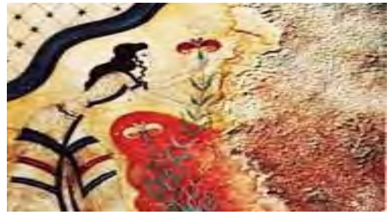
2. نقاشی دیواری زنی در حال چیدن زعفران، کاخ کنوسوس (www.World Media.com, 2018)

نقش زن و مرد در هاگیا تریادا موضوع تصویر 5 است، (براساس شاخص نشانه‌شناسی و وصف) لباس هر دو بلند می‌باشد که نشانه شرکت در مراسم رسمی بوده است. رنگ پوست مرد، قرمز تیره