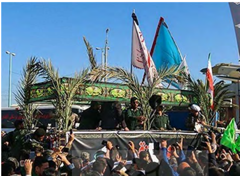
شکل ۱: تشییع پیکر شهید «ابومهدی المهندس» در آبادان. به تزیین انجام شده توسط برگ‌های نخل توجه شود.