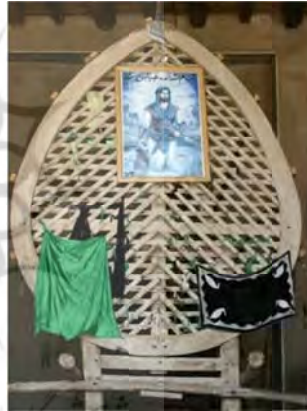
نخل مسجد جامع نطنز