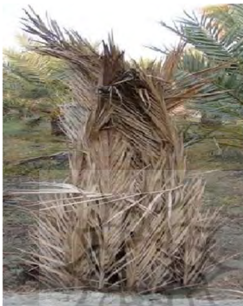
شکل ۲: نهال تازه کاشته شده نخل که توسط برگ‌های نخل مورد محافظت قرار گرفته است. لطفاً به شکل ظاهری آن با تابوت‌واره نخل توجه شود.

شده‌ای که برایش محافظ درست کرده‌اند، نشان داده شده است. دقت در شکل پاجوش کاشته شده‌ای که مورد محافظت قرار گرفته است با تابوت‌واره نخل مشابهت واضحی را به نمایش می‌گذارد.