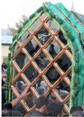
نخل جهادیه سمنان

پس از این، هنرمندان توانستند صفحه مشبک را به شکل‌های دیگر نیز عرضه کنند؛ از جمله صفحه مشبکی که حاصل کنار هم قرار گرفتن متوازی الاضلاع، مربع و یا مخلوطی از این دو باشد. نگارنده با جستجو در فضای مجازی توانستم به نخل‌های تابوت‌واره‌ای دست یابم که شکل‌های متفاوتی داشتند و در نقاط مختلف کشور از آنها استفاده می‌شود. شکل شماره ۴ نشان‌دهنده شماری از این تابوت‌واره‌هاست. تابوت‌واره‌های موجود در «تکیه جهادیه سمنان»، «مسجد جامع نطنز»، و بسیاری از نخل‌های استان یزد (و سایر نقاط کشور) به گونه‌ای طراحی و ساخته شده‌اند که در دو وجه مشبک آنها به ترتیب شکل‌های «لوزی»، «متوازی الاضلاع» و «مربع» مشاهده می‌شود. در «استهبان فارس» نخلی مشاهده شده که در دو وجه مشبک خود دارای ترکیبی از شکل‌های مربع و متوازی الاضلاع است (شکل ۴).