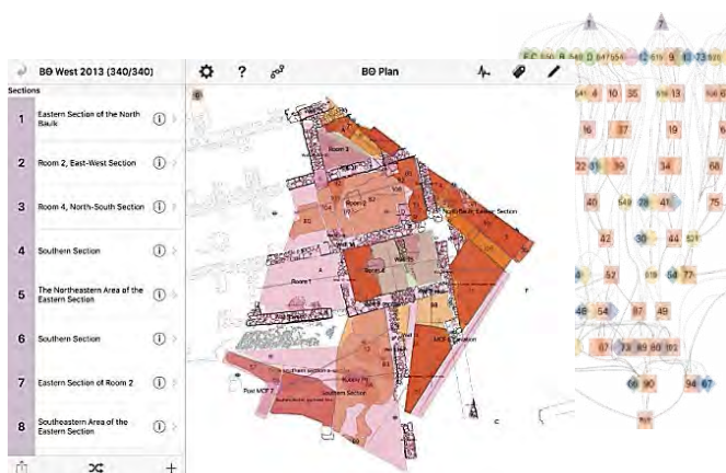
تصویر ۱. پردازش شده توسط نرم افزار ای دیگ ۲۳ (نگارندگان، ۱۳۹۸).