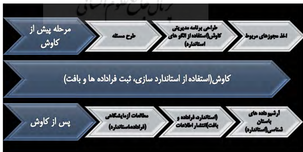
مدل ۲. ارتباط مؤلفه‌های اصلی در استفاده مجدد از داده‌ها (نگارندگان، ۱۳۹۸).