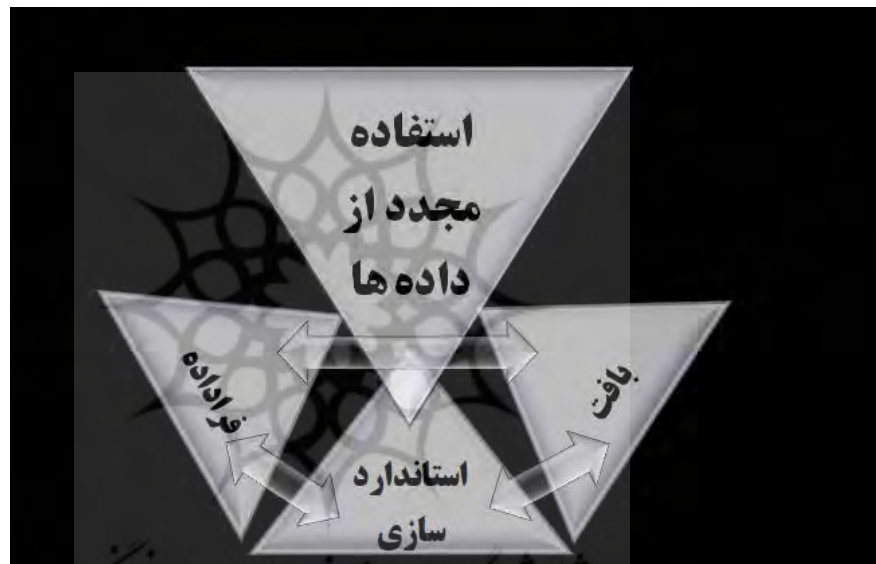
مدل ۱. استفاده از ابزارهای استفاده مجدد از اطلاعات در مراحل پژوهش عملی (نگارندگان، ۱۳۹۸).

سازمان‌های کلان در زمینه مدیریت داده‌ها وجود دارد. سازمان ۱۸ تی دار ۱۹ و سرویس اطلاعات باستان شناسی بریتانیا، ای دی اس ۲۰ ، با هدف دسترسی آزاد به اطلاعات و فراداده‌های استاندارد، برنامه‌ریزی‌های کلان برای توسعه میانی نظری و استانداردسازی اطلاعات اولیه مانند تاریخ‌گذاری و فراداده‌ها (که شامل اطلاعات بافت نیز می‌شود) را آغاز کرده‌اند. محققان می‌توانند براساس دانش خود صحت و اعتبار اطلاعات موجود در پایگاه اطلاعاتی را بررسی کنند. پایگاه اطلاعات آزاد «آرکید» ۲۱ برای شناسایی محققان ایجاد شده است، با استفاده از ای پی آی وب آرکید برای نمایش اطلاعات بیوگرافی و انتشار اطلاعات در مورد مشارکت‌کنندگان در گردآوری اطلاعات، پایگاه اطلاعات آزاد، داده‌های جدیدی را در مورد تخصص و اعتبار باستان‌شناسان گردآورنده اطلاعات، ارائه می‌کند ۲۲ . این سازمان این فراداده‌ها را در قالب چارچوب استاندارد مشخص ارائه می‌کند. نمود دیگری از تعاملات این زمینه‌ها در پایگاه داده‌های اطلاعاتی است که به سبب ماهیت عملکردی، استانداردسازی و استفاده از فراداده‌ها را در برمی‌گیرد.