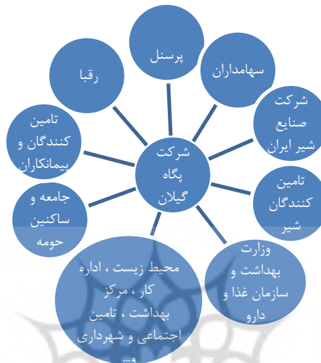
شکل ۴: ذینفعان شرکت شیر پاستوریزه پگاه گیلان

ذینفعان شرکت شیر پاستوریزه پگاه گیلان مطابق شکل ۴ می‌باشند.