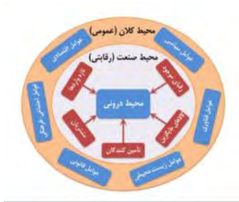
شکل ۲: تحلیل محیط اجتماعی (کلان) و محیط صنعت شرکت شیر پاستوریزه پگاه گیلان