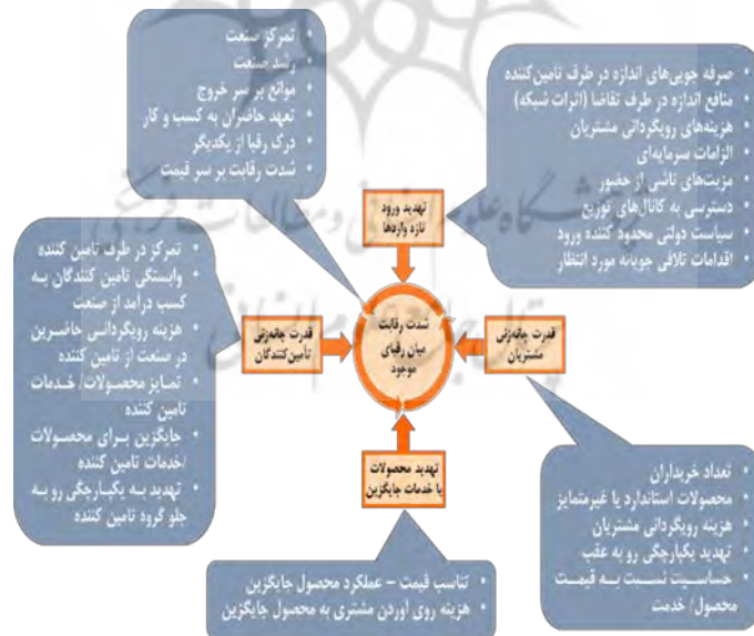
شکل ۳: تحلیل محیط صنعت شرکت شیر پاستوریزه پگاه گیلان (۵ نیروی رقابتی PORTER)

محیط صنعت محیطی اطراف سازمان می‌باشد که سازمان هم از آنها تأثیر می‌گیرد و هم می‌تواند روی آنها تأثیر بگذارد که در شرکت شیر پاستوریزه پگاه گیلان با یادگیری از مدل ۵ نیروی رقابتی پورتر جهت تحلیل محیط صنعت اقداماتی مطابق شکل ۳، صورت پذیرفته است.