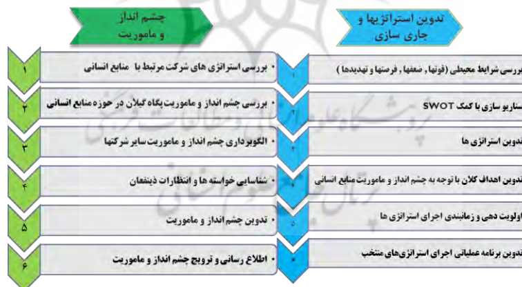
شکل ۱: اقدامات انجام شده برای تدوین برنامه ریزی استراتژیک منابع انسانی

اقدامات انجام شده برای تدوین برنامه ریزی استراتژیک منابع انسانی در شرکت، مطابق شکل ۱ می باشد.